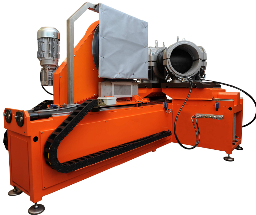
ALFA 630 T von d 225 bis 630 mm