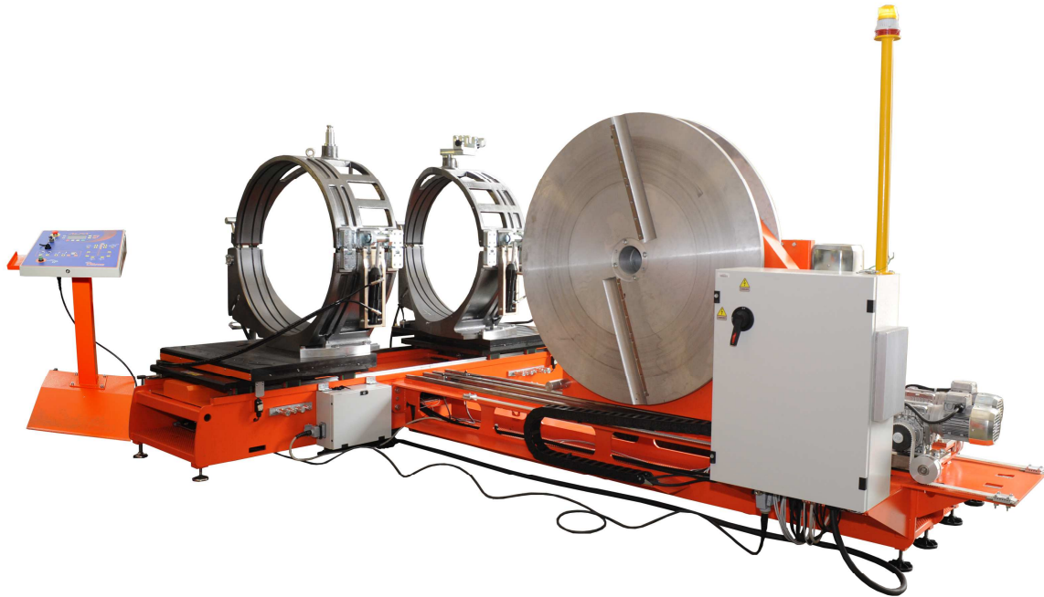
ALFA 1200 von d 630 bis 1200 mm