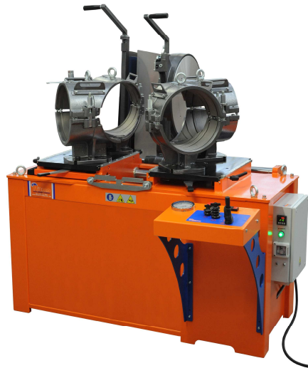
ALFA 400 EASY LIFE von d 110 bis 400 mm