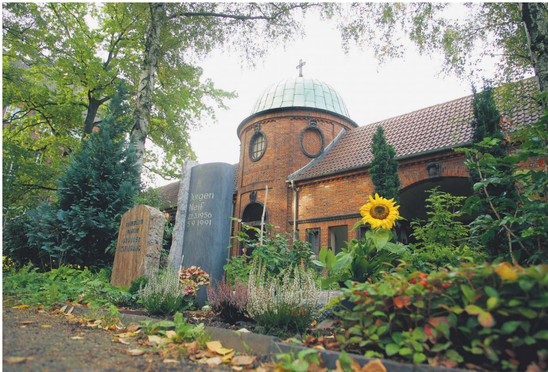
Das Kolumbarium ist kein Taubenschlag, sondern die Urnenwandgrabstätte des Friedhofs Friedenau: eine preiswerte Alternative zur Sargbestattung.