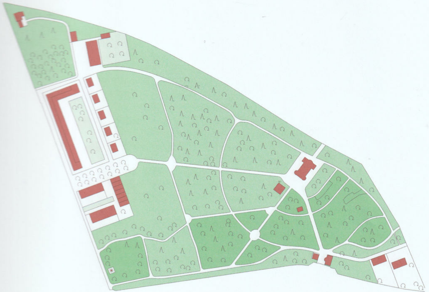
Weitere Großform, kombiniert mit freistehenden Einzelhäusern und einer Reihenhausanlage