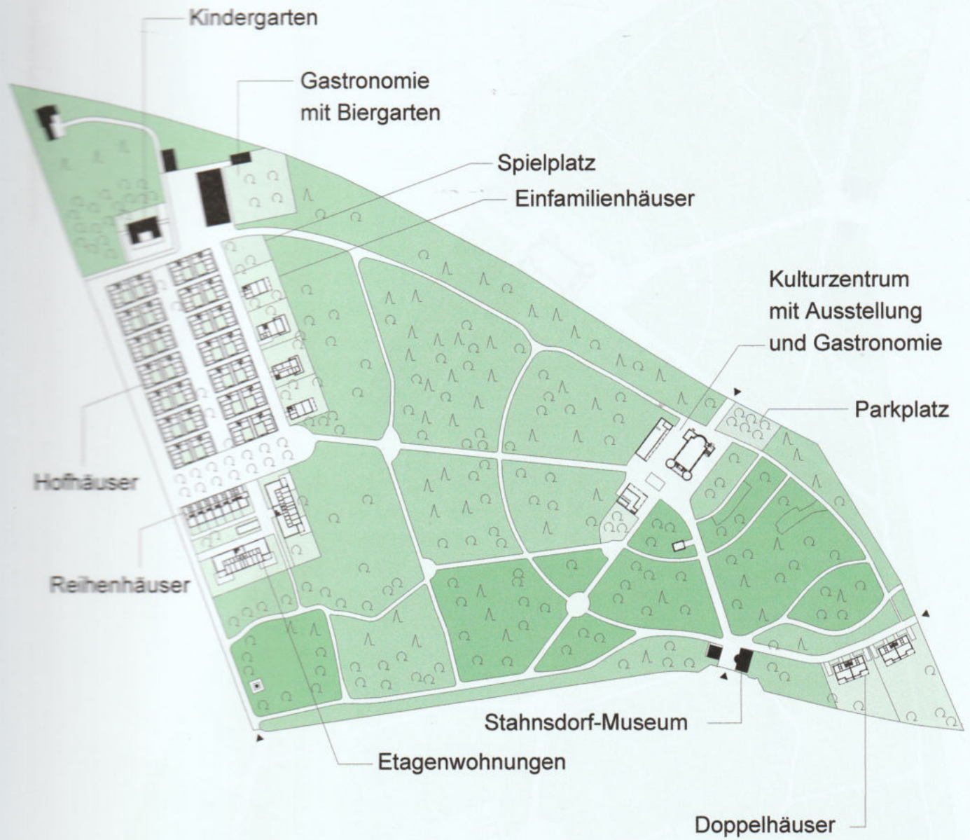
letzte Variante mit Funktionen