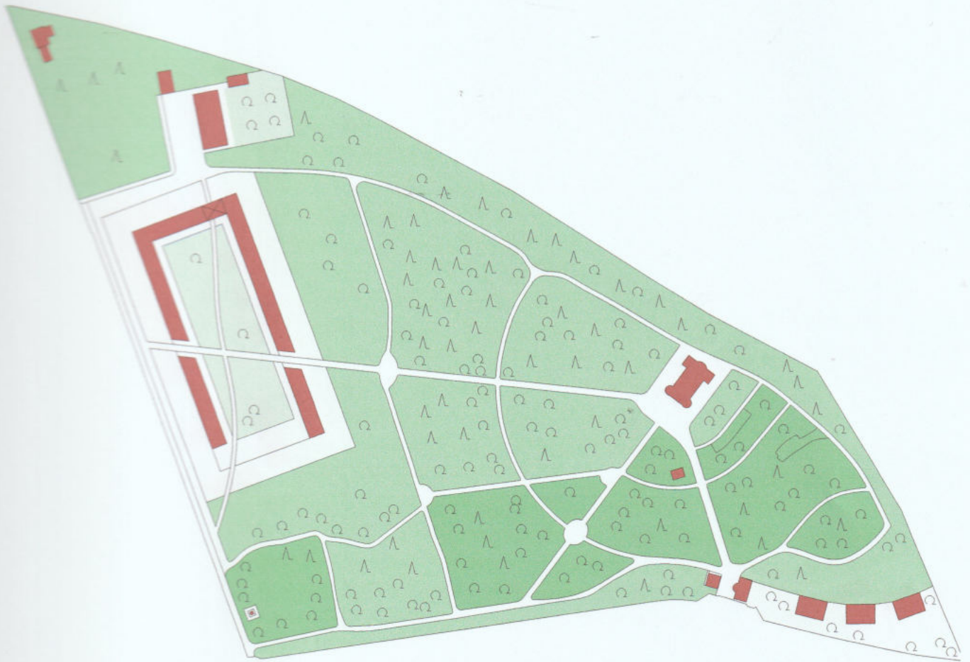
Radikaler Ansatz mit einziger Großform, dem Verkehrslärm abgewandt und mit den privaten Gärten nach innen gerichtet