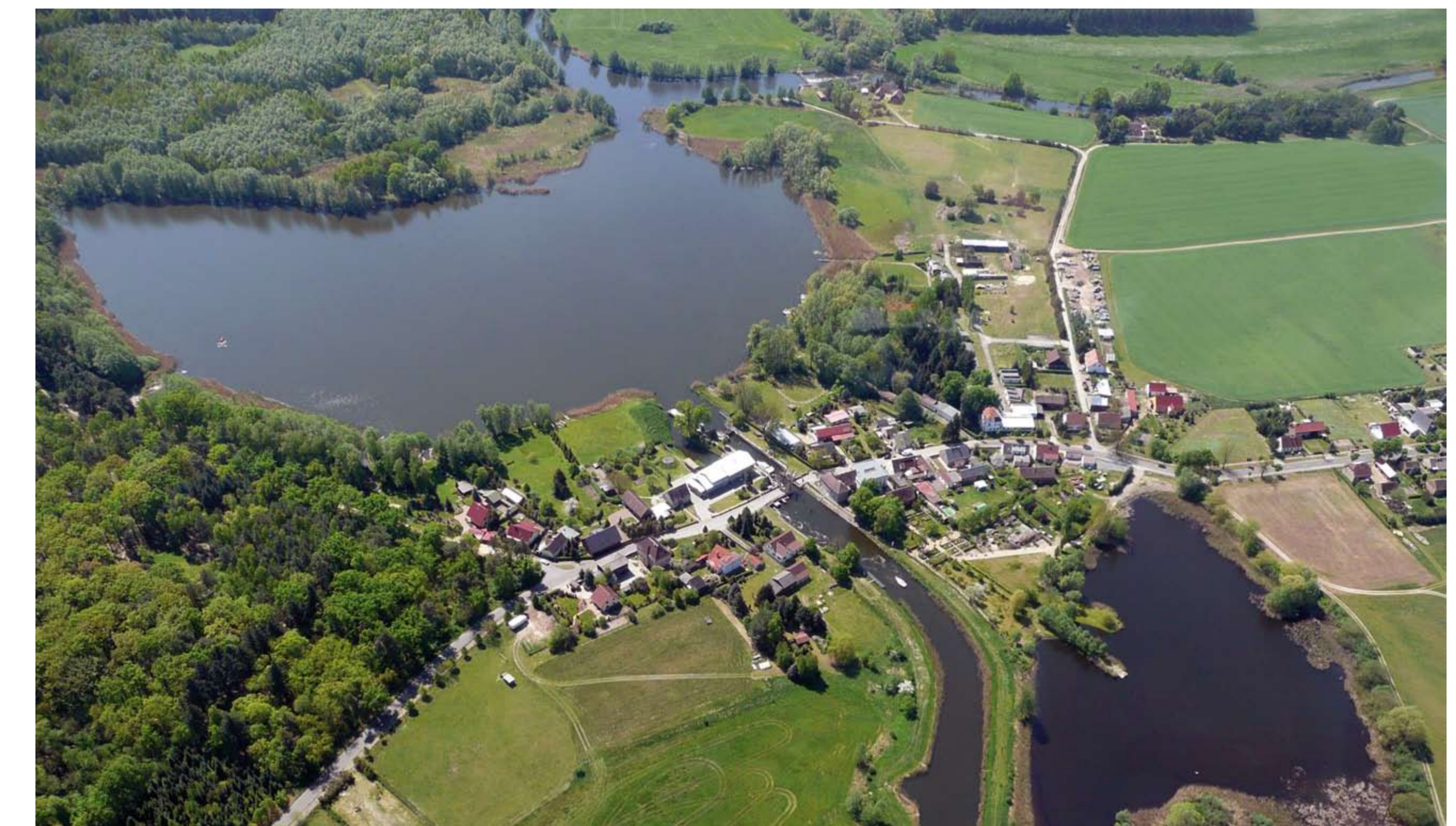
Schleuse und Pumpwerk Neuhaus, Neuhauser Speisekanal und Wergensee, Photo Ulrich Gerwin 2008

Zur Geschichte gehört, dass der Neuhauser Speisekanal sowie Schleuse und Pumpwerk von der Wasser- und Schifffahrtsverwaltung des Bundes verwaltet werden, während die Klappbrücke Eigentum des Landes Brandenburg ist. Unmittelbar nach dem südlichen Schleusentor weist ein Schild daraufhin, dass der Wergensee und damit der historische Flusslauf der Spree eine „Landeswasserstraße Brandenburg“ ist. Güterschifffahrt findet auf dem Abschnitt zwischen Wergensee und Oder-Spree-Kanal schon lange nicht mehr statt. Die Wasserstraße wird überwiegend von Sportbooten genutzt.