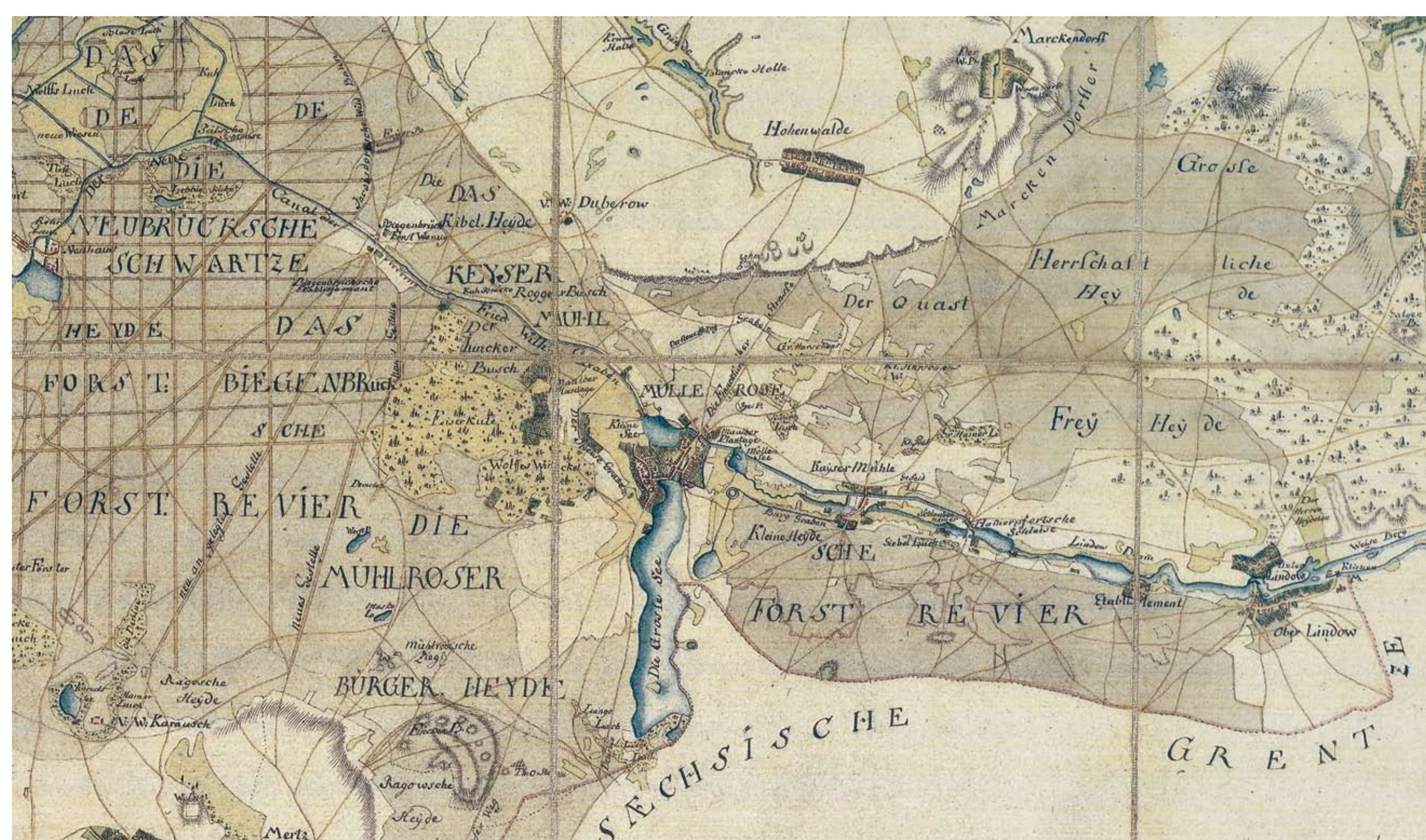
Schmettausche Karte von 1787