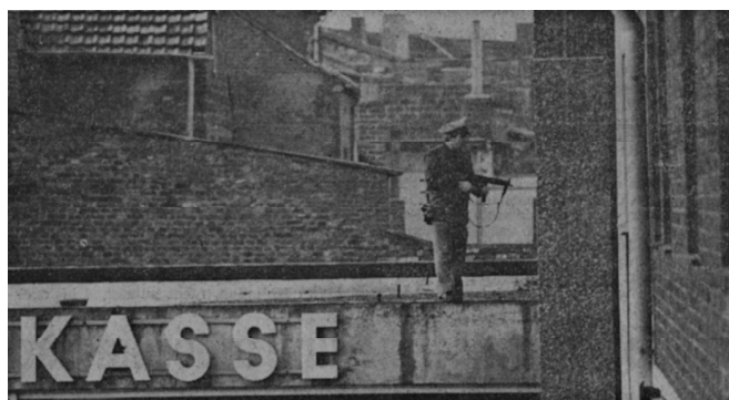
Auf dem Dach des Bankgebäudes waren Präzisionsschützen mit Maschinenpistolen in Stellung gegangen Foto: J. Schmidt

Eine Zusammenstellung der umfangreichen Berichterstattung in den Aachener Nachrichten, der Aachener Volkszeitung, der NRZ, der BILD-Zeitung und dem Express Quelle: Zeitungsarchiv GVS