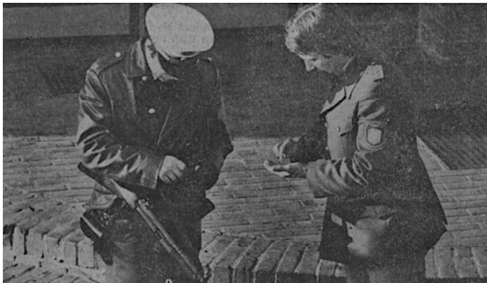
Auch den Wunsch, ihnen eine Packung Zigaretten zu besorgen, erfüllten die Polizeibeamten den beiden Gangstern. Unser Bild zeigt zwei Beamte beim Geldwechsel.