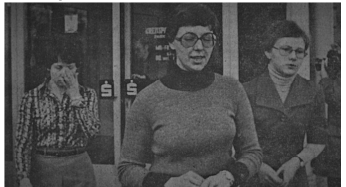
Kurze Zeit nachdem die Bankräuber aufgegeben hatten, verließen drei Geiseln das Bankgebäude. begleitet von Kriminalbeamten.

Um 10.10 Uhr kam die erlösende Mitteilung: „Die Täter sind festgenommen, alle Geiseln sind unverletzt.“