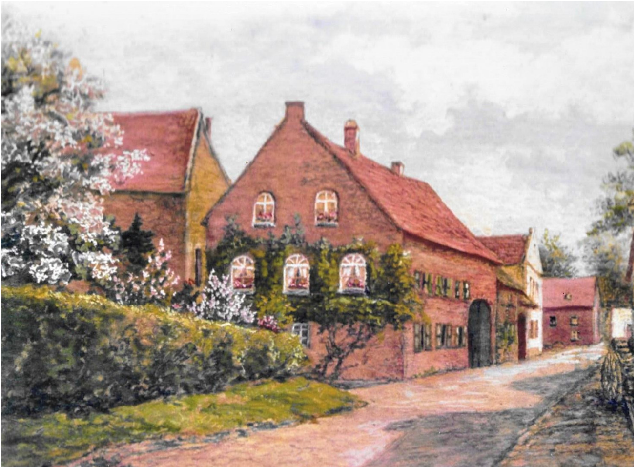
Hof der Familie Pelzer an der Hauptstraße in Setterich um 1900 (heute Ecke Hauptstraße / Emil-Mayrisch-Straße) Fotographie - Gemälde von Toni Heinen-Pelzer,