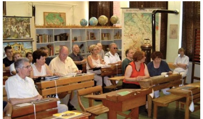
2003 besuchten wir schon mal dieses Klassenzimmer

Bis Ende des Jahres 1962 gehört unser Heimatort Setterich dem Amtsverband Immendorf-Würm an. Der Verwaltungssitz war in Immendorf. Und dorthin führt uns eine besondere Fahrt am 26. August 2021 . Wir besuchen das „Historische Klassenzimmer“ und können dort – hoffentlich bei Präsenzunterricht – an einer „Schulstunde“ teilnehmen.