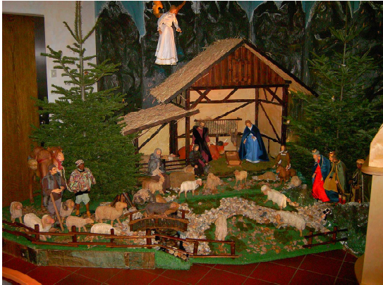
Die Hauskrippe vom Wohn- und Pflegeheim „Maria Hilf“ Burg Setterich

Erstes Treffen ist Samstag, 13.12.08 um 15 Uhr im GVS Arbeitsraum, Andreasschule, Bahnstraße 1.