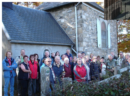
links: Vennwanderung Baraque Michel -Belgien