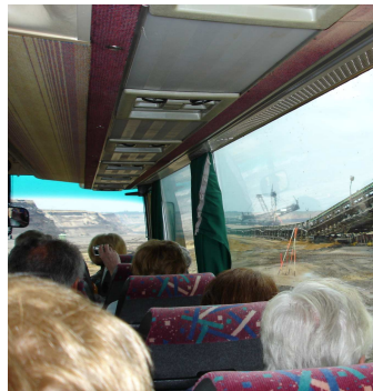
oben: Busfahrt durch den Tagebau Garzweiler II.