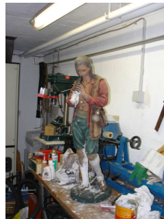
oben: Restaurationsarbeiten der Krippenfiguren.