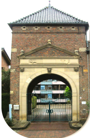
Torturm Burg Setterich

Von 11 – 17 Uhr möchte der Geschichtsverein Setterich Sie am Sonntag, den 11. September zu einer kostenfreien und stündlichen Führung an die denkmalgeschützten Objekten rund um die ehemalige Burg Setterich, An der Burg 1, einladen.