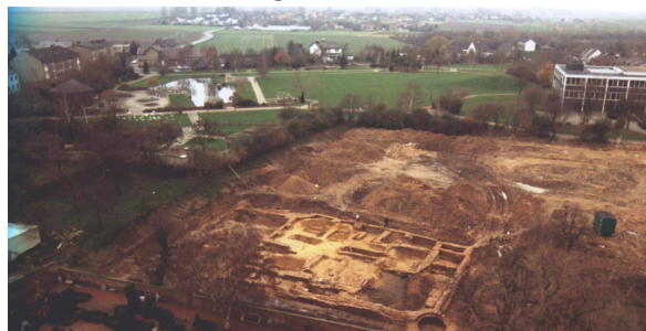
Archäologische Ausgrabungen im Jahre 1982. Die Grundmauern der ehemaligen Burg Setterich

Am 08. April 1997 wurde mit dem Bau des neuen Pfarrzentrums begonnen. Am 20. September 1998 wurde es offiziell eingeweiht.