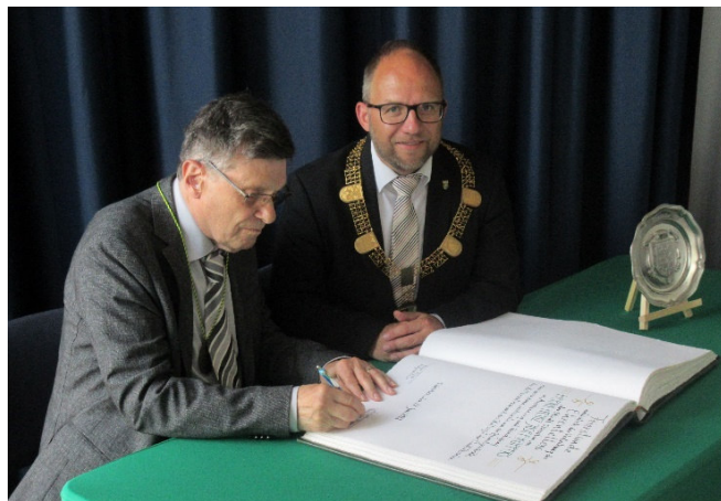
Eintrag in das Goldene Buch der Stadt Würselen

Wenig verwunderlich sei es daher, dass der Geehrte zu den Gründungsmitgliedern des Settericher Geschichtsvereins zählte, zu dessen Ehrenmitglied er 1988 ernannt worden sei.