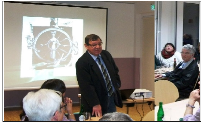
Erinnerung: Der GVS hatte am 10. Oktober 2014 zu einem Vortrag über „Die Schlacht bei Baesweiler“ den bekannten Historiker Armin Meißner aus Eschweiler eingeladen.

Herzog Wilhelm von Jülich geriet bei den Kämpfen in brabantische Gefangenschaft, der Graf von Berg und die Dürener flohen, nur einige Jülicher Vasallen und die Kontingente der Städte Geilenkirchen und Wasenberg hielten den Angriffen Wenzels noch stand.