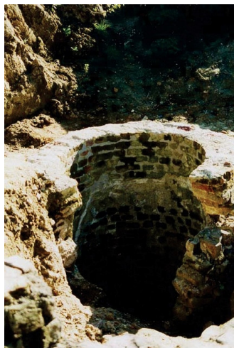
Der Burgbrunnen

Mitte der 1980er Jahre wuchs in Kreisen des Kirchenvorstandes und des Pfarrgemeinderates die Idee, ein neues Pfarr- und Gemeindehaus samt Bücherei für die katholische Kirchengemeinde St. Andreas zu schaffen.