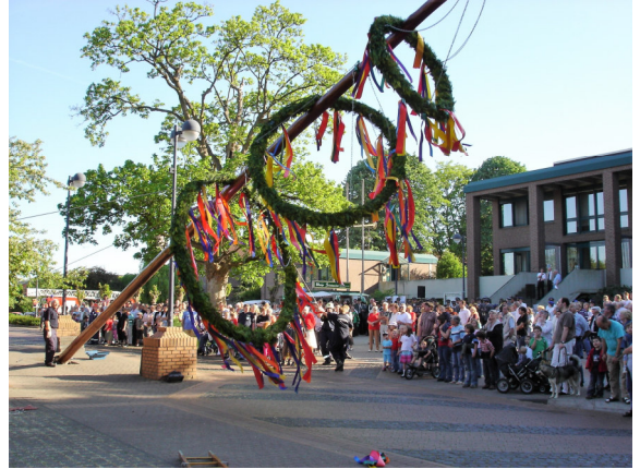
Aufsetzen des Maibaumes im Jahre 2007

Auch für dieses Jahr plant der neue Vorstand der Interessengemeinschaft Settericher Ortsvereine (IGSO) mit der neuen Vorsitzenden Martina Jansen die Durchführung einer Maifeier und die Aufstellung des Maibaumes unter Beteiligung vieler Ortsvereine.