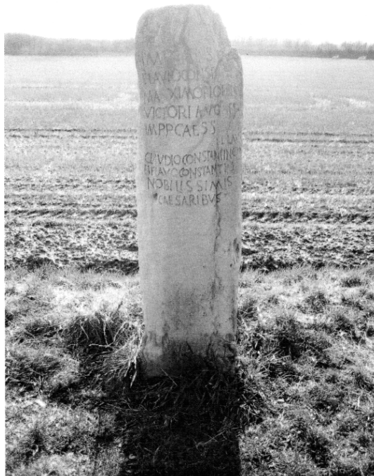
Nachbildung eines Leugensteins am Linderberger Wald bei Jülich

Umfangreiche Recherchen unseres Vereinsmitgliedes Alexander Plum legen nahe, dass bei Einhalten der Streckenabschnitte von 2,2 km der Stein mit der Nummer 23 am Lohwald bei Gut Röttgen gestanden haben muss.