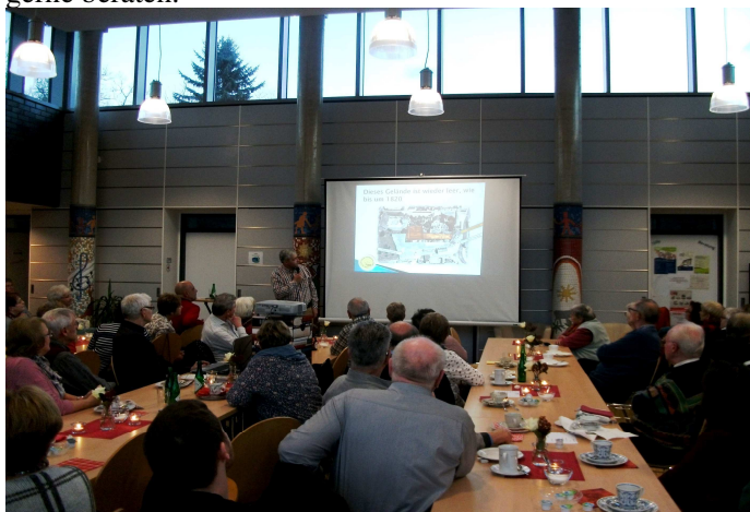
Diavortrag zur Familienforschung