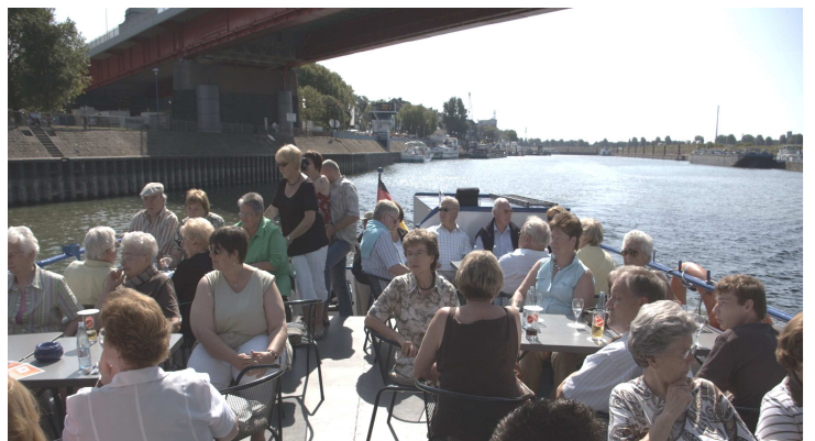
Genuss an Deck eines Ausflugschiffes

in den vergangenen Monaten veranstalteten wir aus unserem Jahresprogramm zwei Besichtigungsfahrten unterschiedlicher Art. Unsere alljährliche Tagestour führte uns am 23. August zum größten Binnenhafen Europas nach Duisburg. Die 2stündige Schifffahrt, der Besuch des Deutschen Binnenschifffahrtsmuseums und das strahlendem Sommerwetter trugen zu einem gelungenen Tag bei.