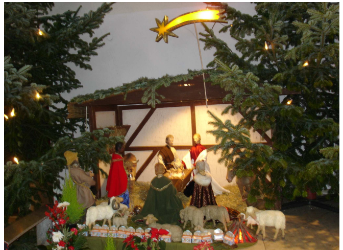
Krippe der kath. Kirche St. Andreas Setterich

Mithilfe bei unserer ersten Ausstellung. So können wir ihnen über 25 Krippen auf einer Fläche von ca. 100 qm in einer vorweihnachtlichen Atmosphäre präsentieren.