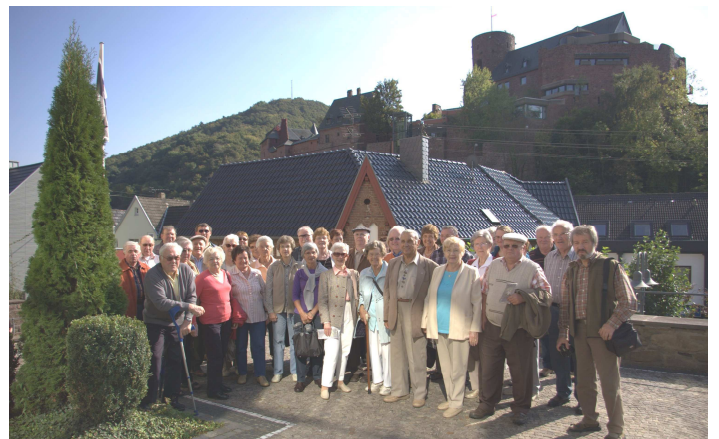
.. schöner Tag mit einer tollen Gruppe unter der Burg Heimbach

Wie bei allen unseren Fahrten waren uns Erholungspausen in gemütlicher Umgebung, bei gutem Essen und Kaffee und Kuchen, wichtig.