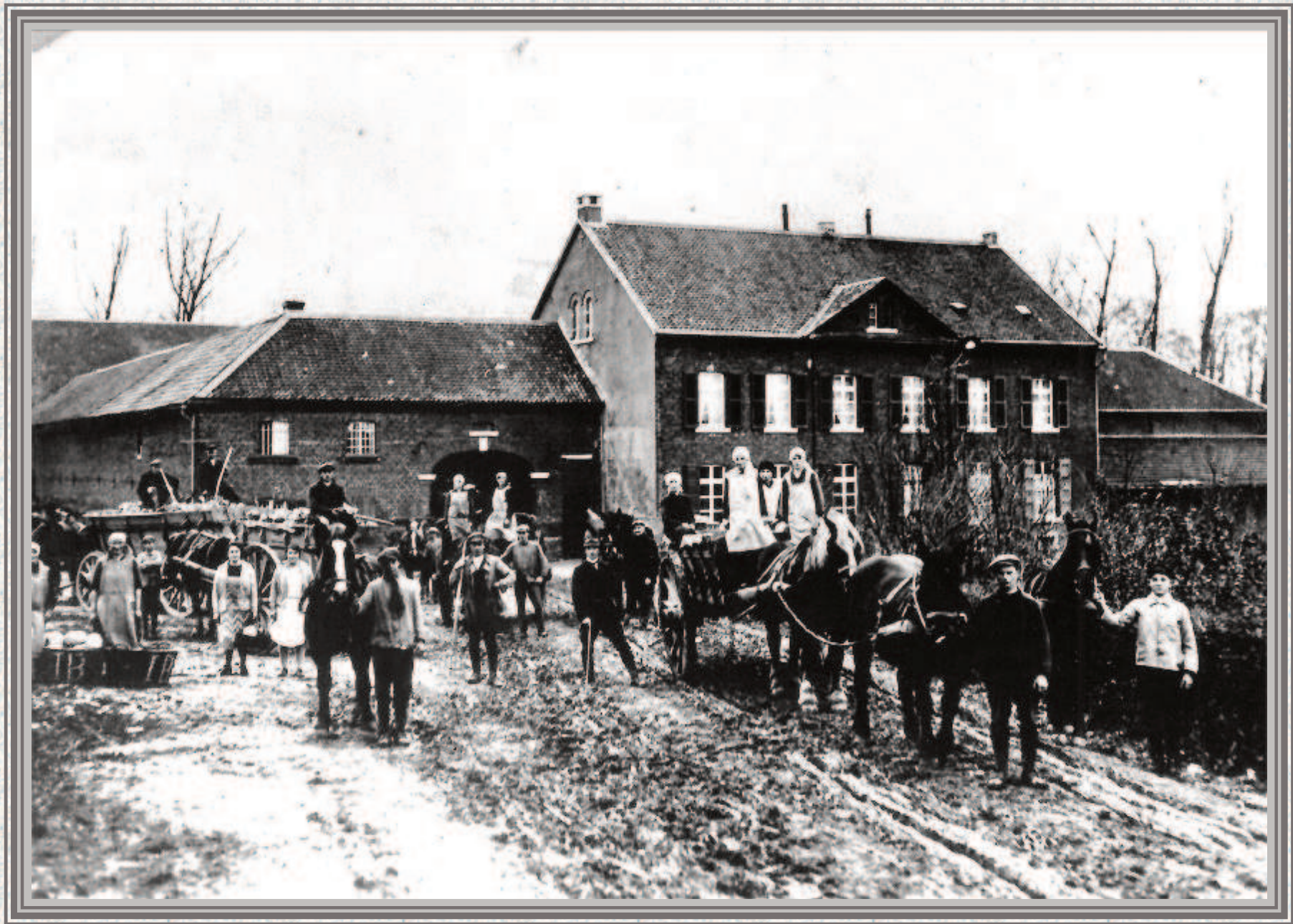
Der Röttgenhof um 1925