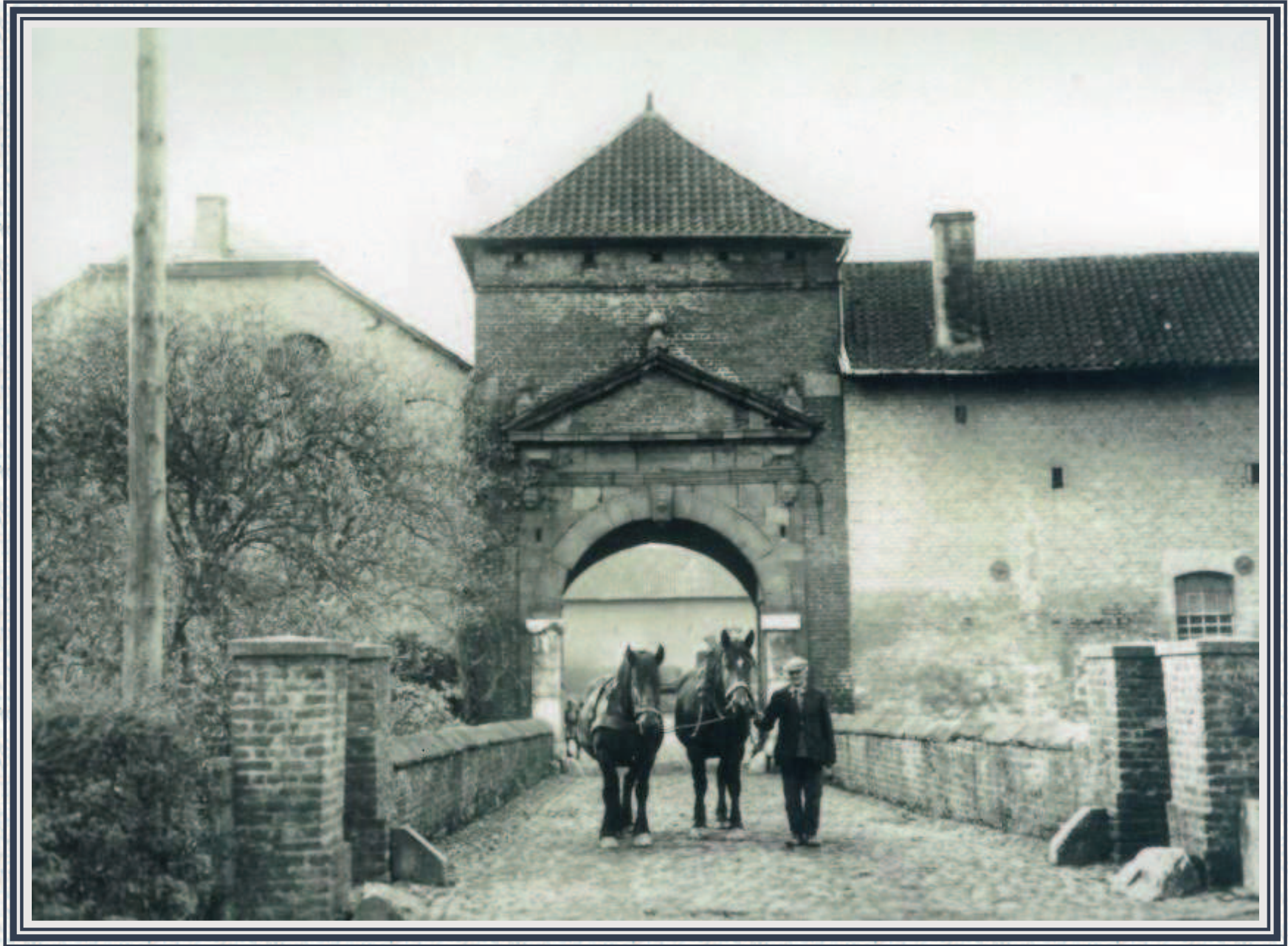
Gutshof – Burg Setterich