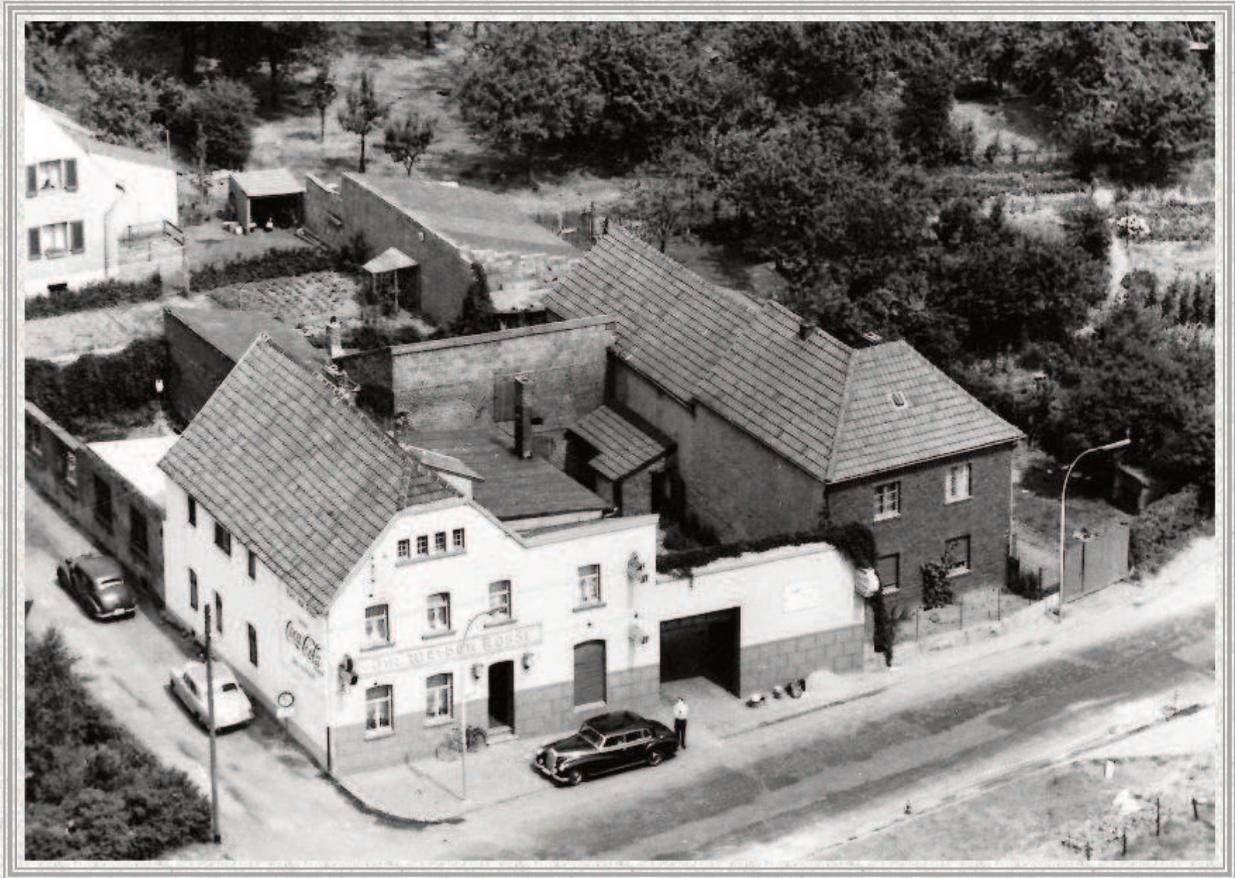
„Im weißen Rössl“ Restaurant in Setterich - 1935