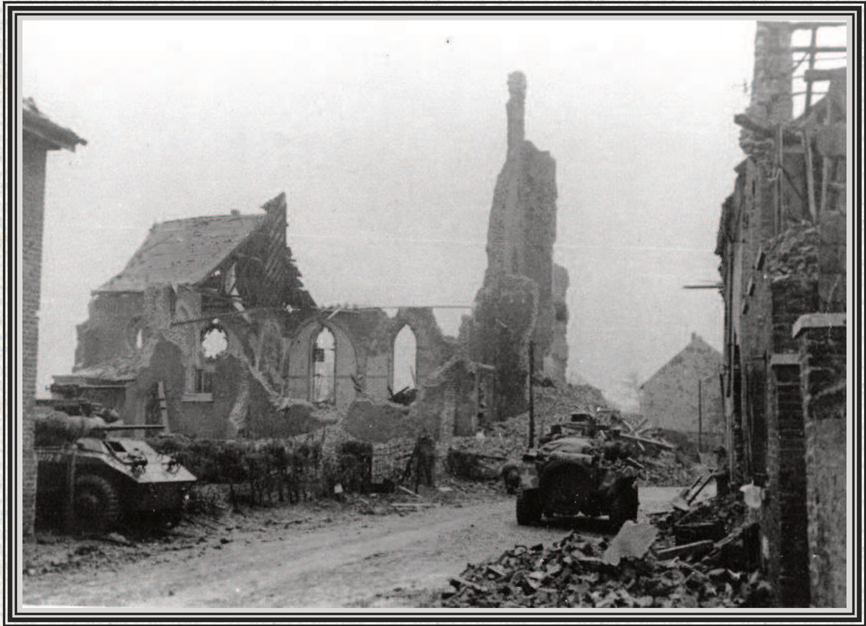
Setterich im November 1944