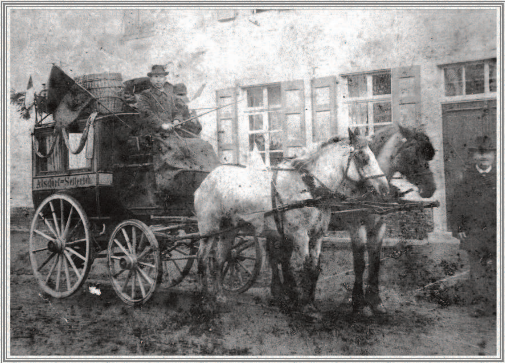
Die letzte Fahrt unserer Postkutsche