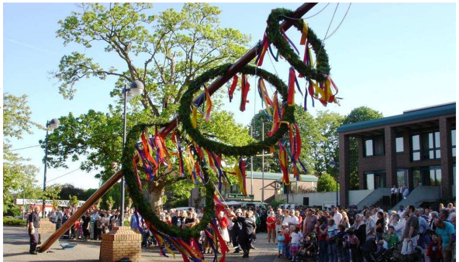
Maibaumaufstellung am Rathaus Setterich