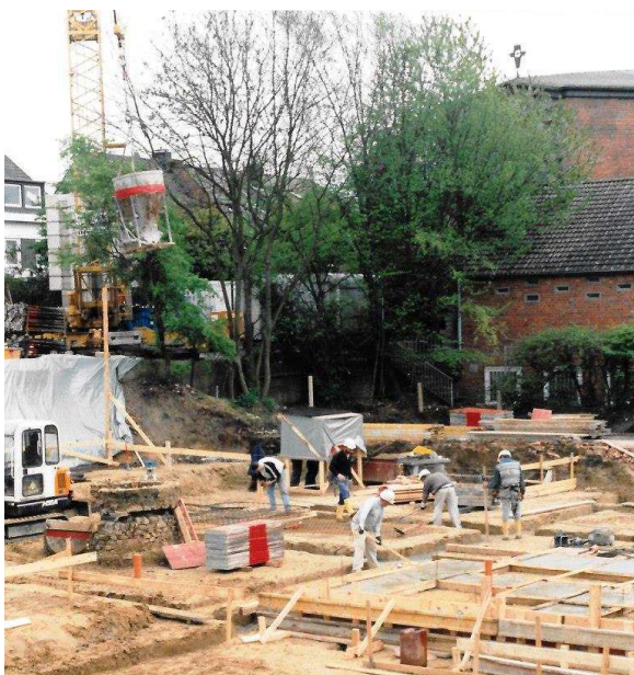
Bild zur Historie- vor 20 Jahren – Auf historischen Mauern... Baubeginn – links der erhaltungswürdige Brunnen der alten Burg, der im Pfarrzentrum zu bewundern ist.

Wir bedanken uns im Namen der Mitglieder.