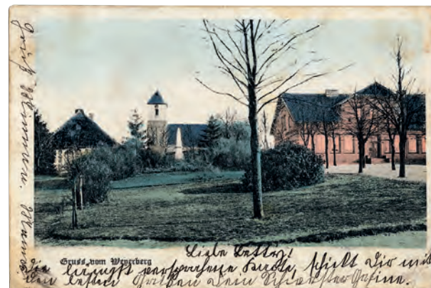
Grüß vom Weyerberg mit Zionskirche (erbaut 1759)

Finale: Schließung des Festgeländes und Orgelkon- zert in der Zionskirche