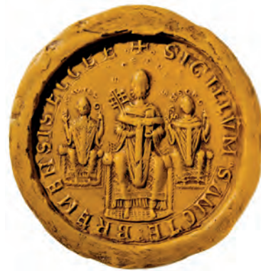
2. Siegel Domkapitel Bremen