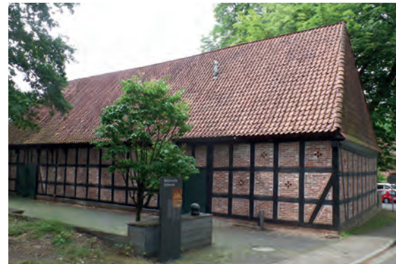
Bötjersche Scheune, aktuelle Ansicht

Am Sonnabend (19–22 Uhr) lockt die Taverne zum fröhlichen Beisammensein mit Tanz; die Gruppe WORTSATIA tritt mit historischer Musik auf.