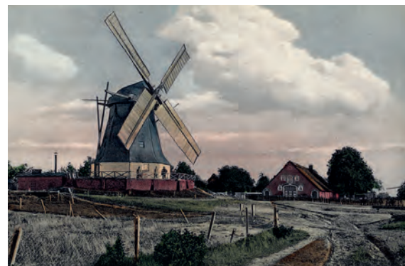
Historische Postkarte, Worpsweder Mühle (1838)

Veranstaltungsgelände: Kinderangebote; Malvorführungen; Worpsweder Künstler; Kunsthandwerker; Vereine; Institutionen; Stiftungen und einzelne Akteure; Autoren lesen im Lesezelt. Rathaus: Ausstellung und Videovorführung; Kindertheater (12/15/17 Uhr)