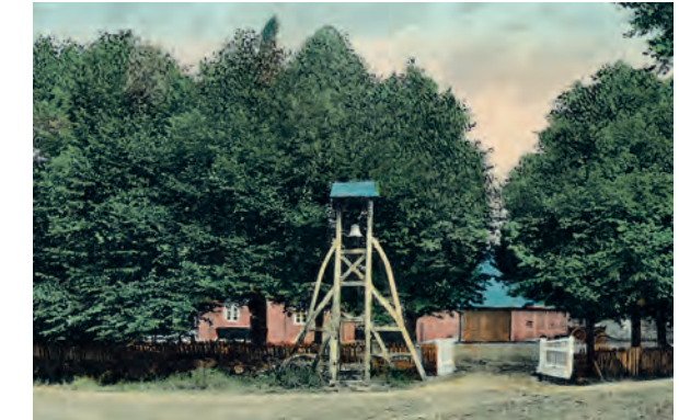
Gruß aus Worpswede mit alter Dorfglocke (1699)