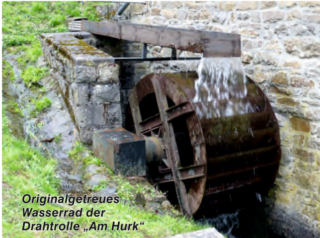
Originalgetreues Wasserrad der Drahtrolle „Am Hurk“

Altena ist bekannt als Zentrum der frühen Drahtherstellung. Im Land des Wassers und des Eisens, dem WasserEisen-Land, wird bis heute Draht für vielfältige Anwendungen hier in Altena hergestellt. Darüber hinaus fertigt die Industrie aus dem Rohstoff Draht auch eine Vielzahl von speziellen Erzeugnissen für die unterschiedlichsten Zwecke.