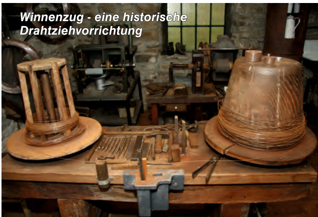
Winnenzug - eine historische Drahtziehvorrichtung

Hier kann man ausgezeichnet nachvollziehen, wie Wasserkraft auf äußerst effektive Weise für die industrielle Produktion verwendet wurde. 16 großformatige Informationstafeln laden zu einer 700 m langen Erkundungstour ein, die mit dem Besuch weiterer Ausflugsziele in Altena sehr gut kombinierbar ist. Führungen sind buchbar.