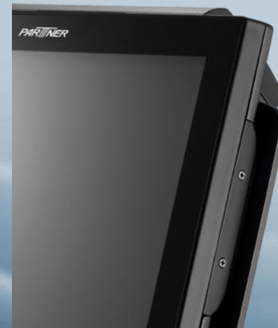
3-Track MSR oculto