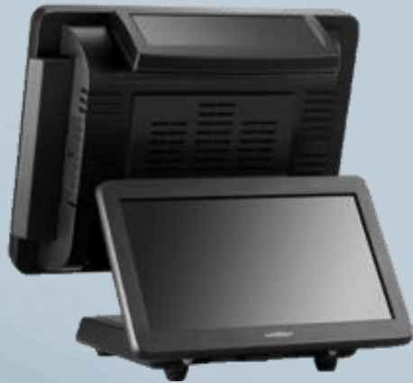
SP-650 con 2x20 VFD y VGA color 11.6"