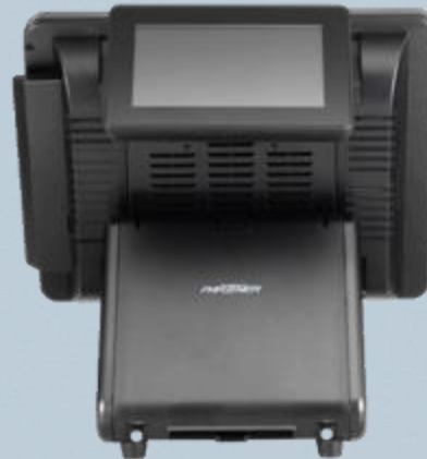
SP-650 con 7" color gráfico CD70