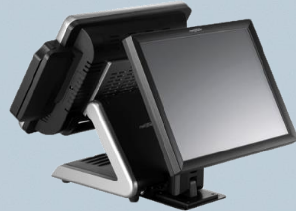
SP-650 con FMS-200 y 11.6" o 15"*