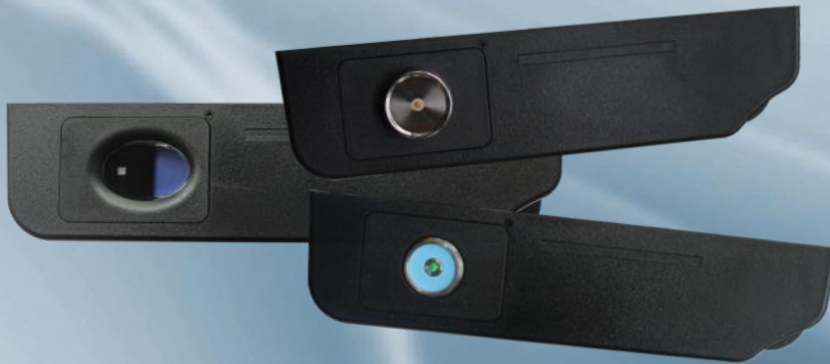
Multilector para: I-Button o Dallas key o Addimat, Fingerprint, MSR, RFID, smartcard