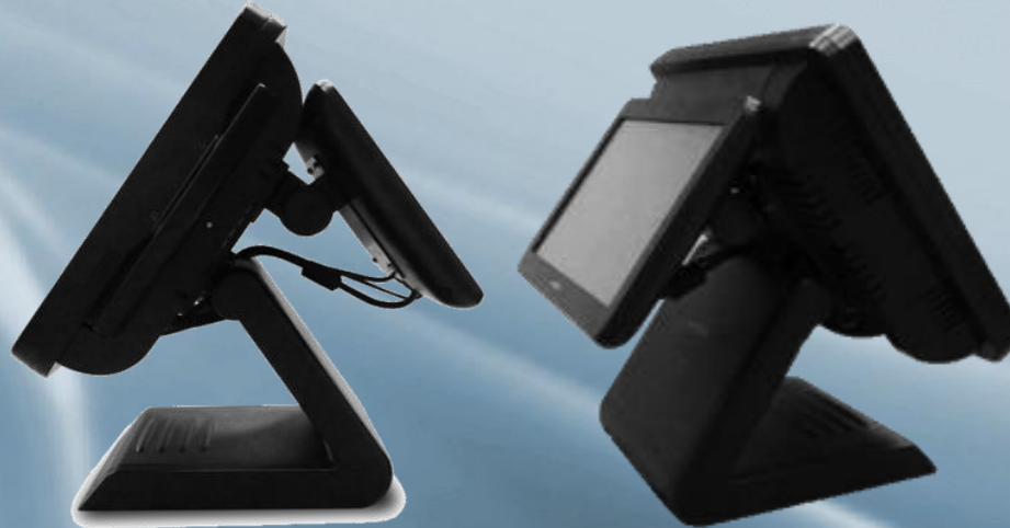
SP-650 con 15" o 11.6" Montaje Dual bracket *