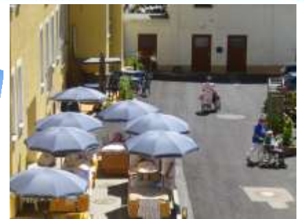
Frischluftaufenthalt für Bettlägerige