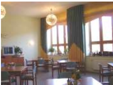
unser Speise- & Kulturraum