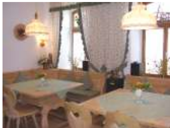
Hier richten wir Familienfeiern für Sie aus.