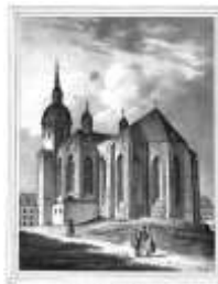
zur Stk. Annen Kirche