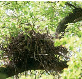
Alte Eiche mit Schwarzstorchhorst

Sollten Sie noch Fragen zur Auswahl haben oder glauben, ein in Ihrem Besitz befindlicher Baum sei für das Projekt geeignet, wenden Sie sich bitte an die Biologischen Stationen Oberberg oder Rhein-Berg.