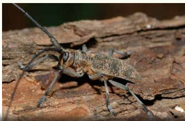
Bockkäfer auf Totholz

Bäume, die diese Lebensräume bieten, sind meist alt, knorrig, mit Totholzanteilen und natürlichen Höhlen. Sie haben überwiegend einen geringen wirtschaftlichen, aber enormen ökologischen Wert.