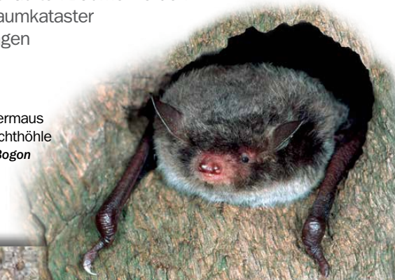
Wasserfledermaus in alter Spechthöhle