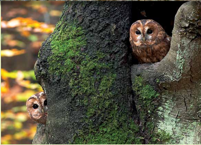
Waldkäuze in den Höhlen einer Rotbuche, Foto: Reiner Jacobs