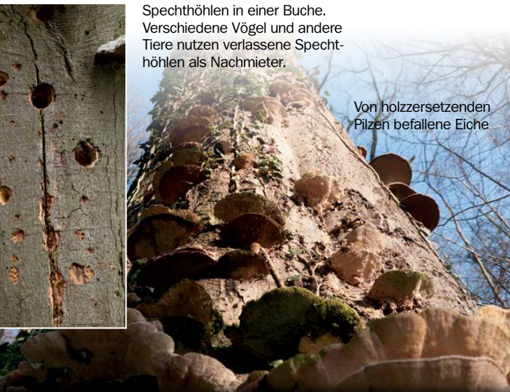
Spechthöhlen in einer Buche. Verschiedene Vögel und andere Tiere nutzen verlassene Spechthöhlen als Nachmieter.