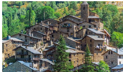
Os de Civis

Départ après le petit déjeuner vers la Seu d'Urgell . Découverte du village, siège de l'Évêque d'Urgell (Co-Prince de la Principauté) et ville olympique. Promenade par les ruelles autour de la cathédrale, dans les rues commerçantes. Découverte du siège des JO 92 de canoë-kayak. Puis passant par Aixovall et Vixéssarri, les gorges rocheuses d'Os, donnent l'unique accès au pittoresque