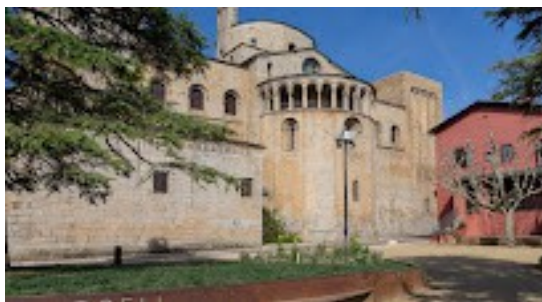
Cathédrale de Seu d'Urgell