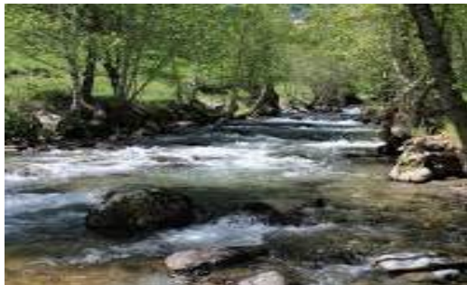
Valira du Nord