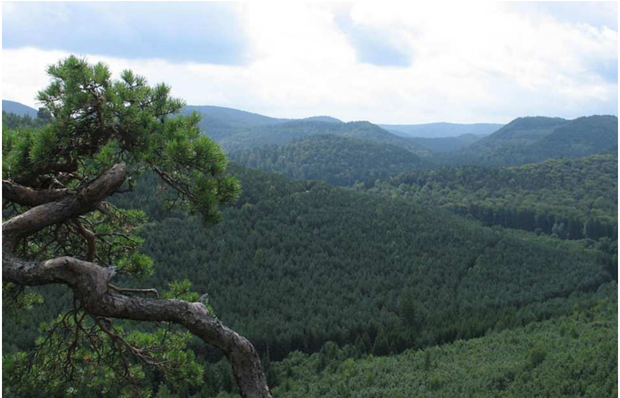
Die Traumlandschaft Pfälzerwald

Am zweiten Tag hält uns das tiefe Grün und die Traumlandschaft des Pfälzerwald umfängen. Wir reiten durch das größte und schönste Waldgebiet Deutschlands in südlicher Richtung durch das Biosphärenreservat Pfälzerwald-Nordvogesen auf die Grenze Frankreichs zu. Direkt unterhalb von Château Langenberg erreichen wir an der Grenze zu Frankreich unsere zweite Station.