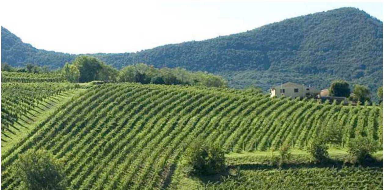
Die Pfälzer Weinstraße mit Blick auf den Ostrand des Pfälzerwald

Unser dritter und letzter Reittag führt uns ein kurzes Wegstück durch das Elsass und weiter durch das Deutsche Weintor in Schweigen-Rechtenbach, wo wir der Deutschen Weinstraße folgen. Damit sind wir wieder in der Zivilisation angekommen und biegen nach wenigen Kilometern Richtung Osten ab um durch überwiegend landwirtschaftlich genutzte Flächen, mit Blick auf den Pfälzerwald zur linken und den Bienwald zur Rechten, unseren Startpunkt in Steinweiler wieder zu erreichen.