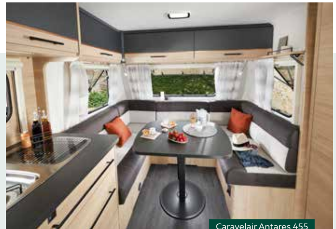
Caravelair Antares 455