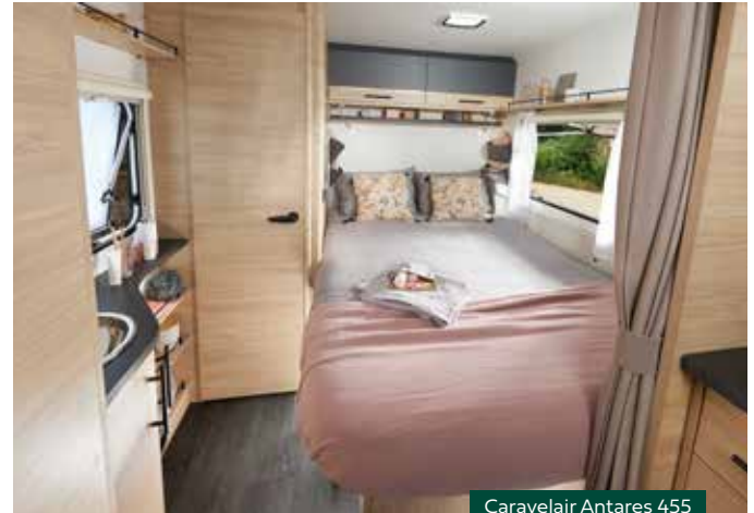
Caravelair Antares 455