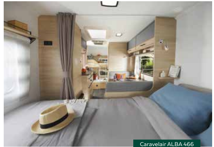
Caravelair ALBA 466