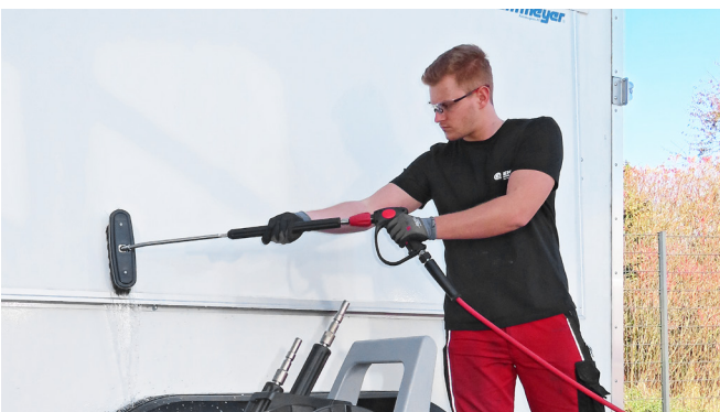
Flächenwaschbürste für empfindliche Oberflächen Waschbreite 300mm Naturhaar Art-Nr. 900155