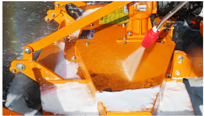
Rotierende Düse mit Edelstahlstrahlrohr (bei KD523 Premium im Standard-Lieferumfang Art-Nr. 900181)