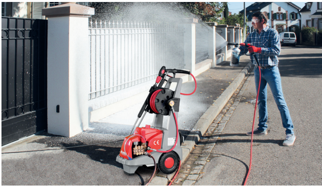
Schaumlanze mit Variodüse und 2l Chemie-Behälter Art-Nr. 410702