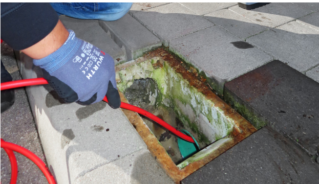
Rohreinigungsschlauch mit Sprühstrahl und Vortrieb 15m Art-Nr. 911119