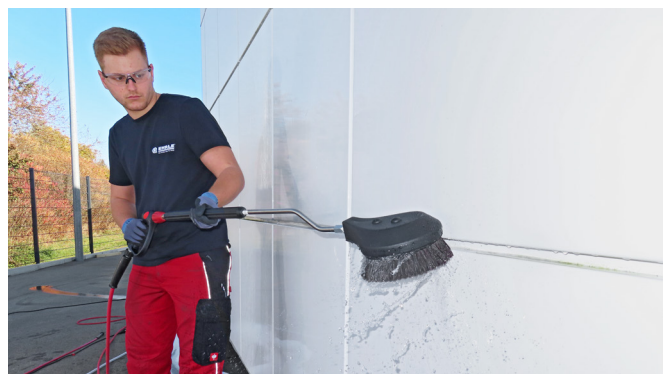
Rotierende Waschbürste für schwierige Formen 200mm Durchmesser Naturhaar Art-Nr. 900156