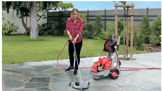
Boden-Flächenreiniger aus Edelstahl 300mm Durchmesser Art-Nr. 394078