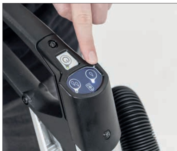
8. Es gibt zwei Einstellungsmöglichkeiten: 1 Tropfen für normale Verschmutzungen 2 Tropfen für starke Verschmutzungen