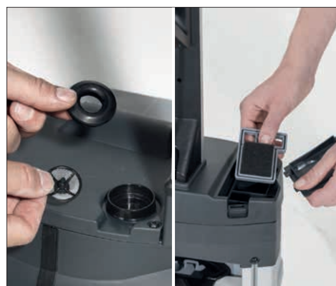
16. Überprüfen Sie die Filter regelmäßig und reinigen diese bei Bedarf.