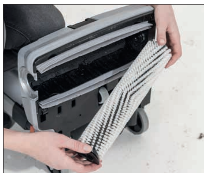
18. Bürste am Knopf im Uhrzeigersinn drehen um diese zu entnehmen.