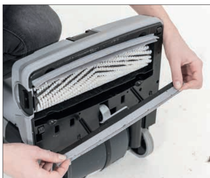
17. Beide Saugleisten entnehmen.