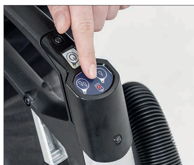
11. Wenn die Reinigungslösung zur Neige geht blinkt das Tanksymbol rot. Ist der Tank völlig leer, leuchtet es permanent. Entleeren/Befüllen Sie den Schmutz-/Frischwassertank um erneut zu reinigen.