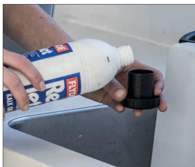
3. Der Tankdeckel kann zum Dosieren des Reinigungsmittels verwendet werden. Ein voller Deckel enthält 30 ml, was bei einem Tankinhalt von 3 l eine 1%ige Reinigungsmittelkonzentration ergibt.