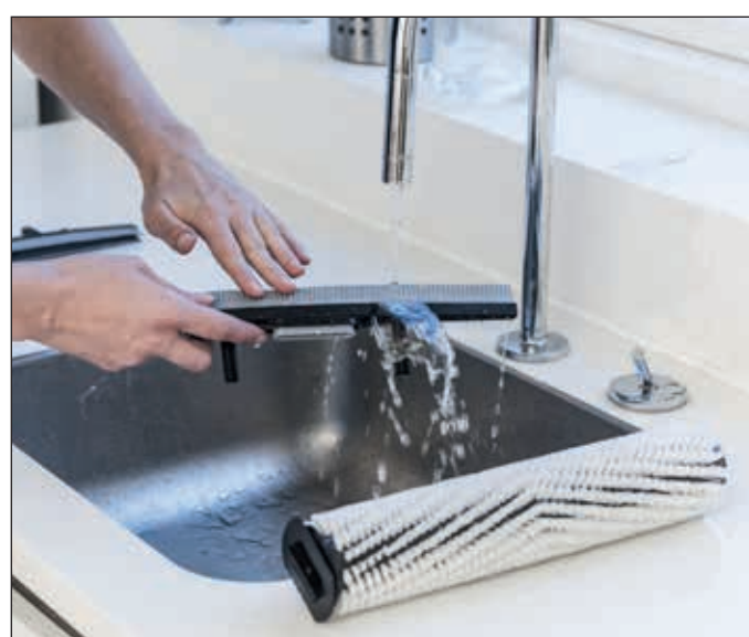
19. Reinigen Sie nun Saugleisten und Bürste. Überprüfen Sie die Teile hierbei auf Beschädigungen und ersetzen diese ggf..