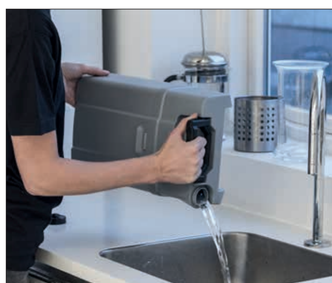
15. Beide Tanks entleeren und mit Frischwasser reinigen.