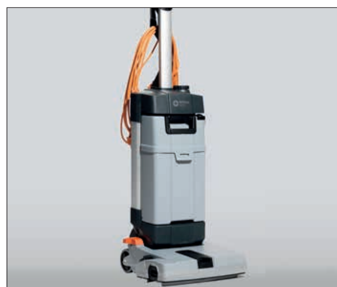
20. Zuletzt reinigen Sie auch die Maschine mit einem feuchten Tuch und evtl. einem neutralen Reiniger. Danach kann die Maschine an einem geeigneten Platz aufbewahrt werden.

(*) BEFOLGEN SIE BITTE IMMER DIE DOSIERUNGSANLEITUNG AUF DEM REINIGUNGSMITTELBEHÄLTER.