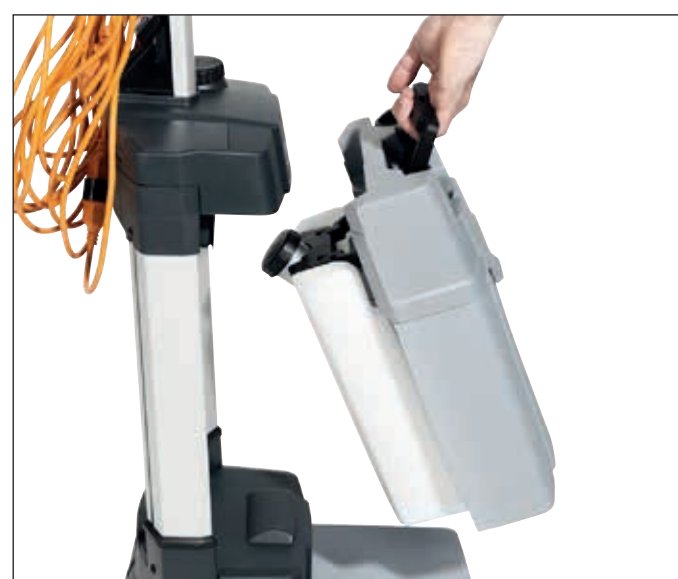
1. Entriegeln und entnehmen Sie den Frischwassertank mit dem Griff

ACHTUNG! Lesen Sie die Bedienungsanleitung vollständig, bevor Sie die Maschine in Betrieb nehmen. Nehmen Sie die Maschine nicht in Betrieb, wenn Unklarheiten vorliegen.