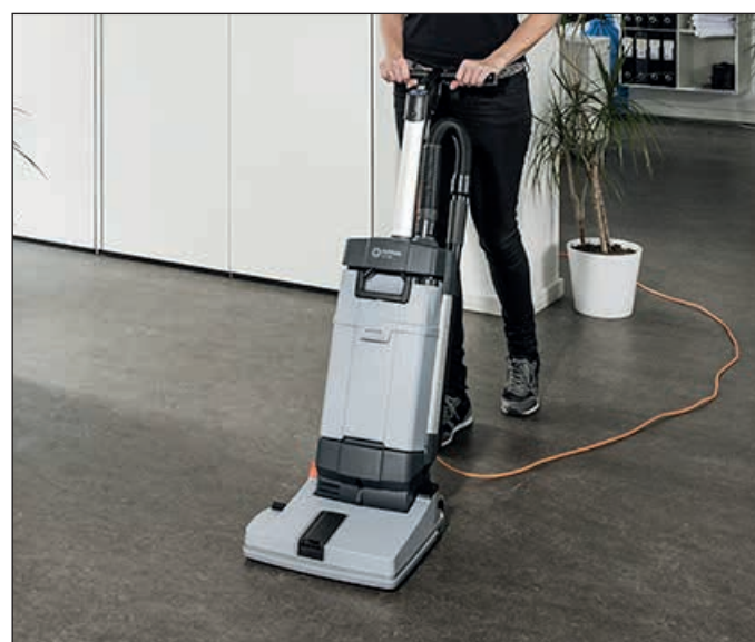
9. Positionieren Sie die Hände auf dem Griffelement und führen die Reinigung fort.