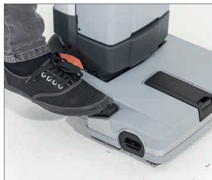
10. Um starke Verschmutzungen einzuweichen heben Sie die Saugleiste durch Betätigung des Pedals an. Senken Sie anschließend die Saugleiste ab, um die Reinigungslösung wieder aufzunehmen.