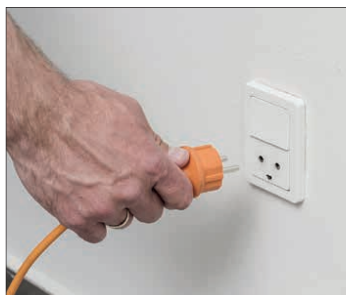
4. Stecken Sie den Netzstecker in eine Steckdose.