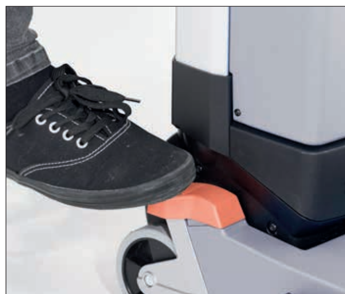
6. Orangefarbenes Pedal betätigen und die Maschine in Arbeitsposition bringen.