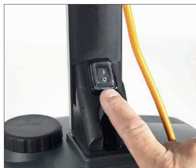
5. Schalter auf „I“ stellen.