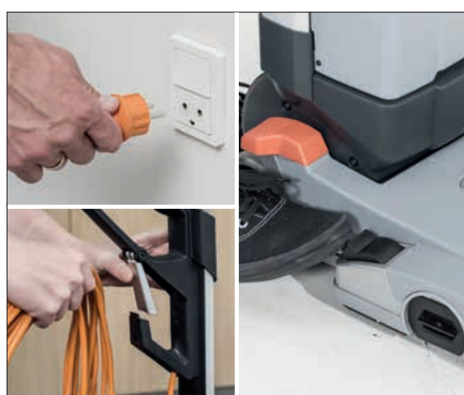
14. Netzstecker ziehen, Kabel aufwickeln sowie in den Clip einhängen. Zusätzlich Parkpedal betätigen, wenn die Maschine abgestellt wird.