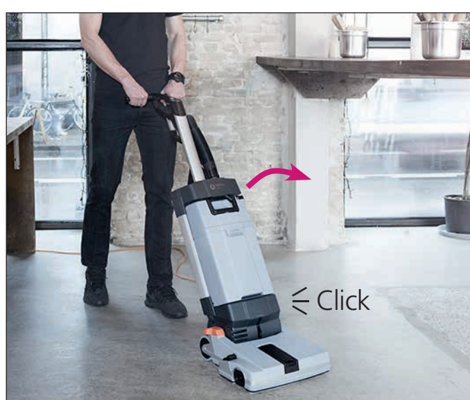
13. Ist die Reinigung beendet, schalten Sie die Maschine am Display und am Hauptschalter aus („0“).