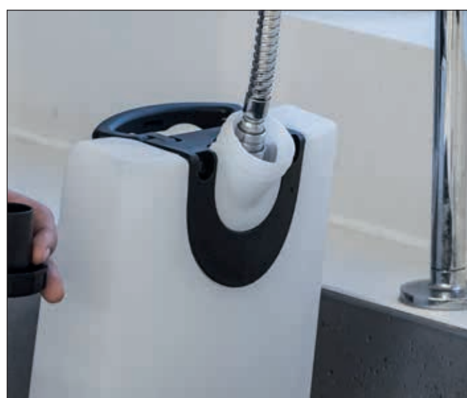
2. Füllen Sie den Frischwassertank mit max. 40 Grad heißem Wasser. Danach wird der Tank wieder in der Maschine befestigt.