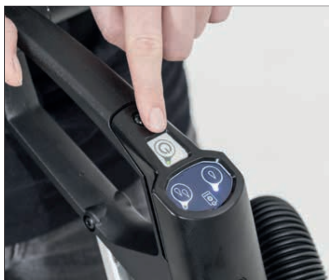
7. Drücken sie den Ein-Schalter und beginnen mit der Reinigung (die Maschine stoppt automatisch wenn sie in aufrechter Position geparkt wird).