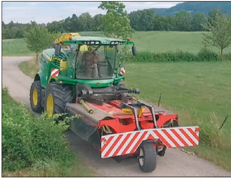
Für die Serien 8000/9000 von John Deere ist ein Stützrad erforderlich.

und sowieso wieder neu austreiben soll, war es für den Landwirt völlig in Ordnung, dass die Stoppel etwas länger blieben. Ab dann lief alles glatt, die Maschine zog sehr ordentlich durch den Bestand. Durch den im Einzug des New Holland-Häckslers integrierten Pendelausgleich tastete das CD 610 alle Bodenunebenheiten sicher ab. Für die Maschinen von Claas wird ein integrierter, mechanisch federbelasteter Pendelantriebsrahmen inkl.