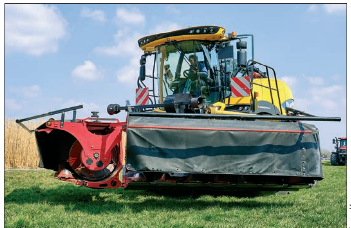
Geklappt ragen die beiden Hälften nach vorne, wodurch kein Umbau oder Schneidwerkswagen nötig ist.