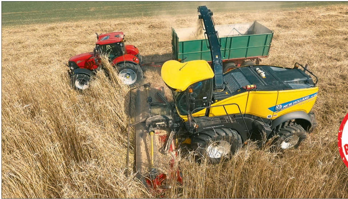
Das Gruber Compact Disc 610 kam mit dem harten Miscanthus gut zurecht.