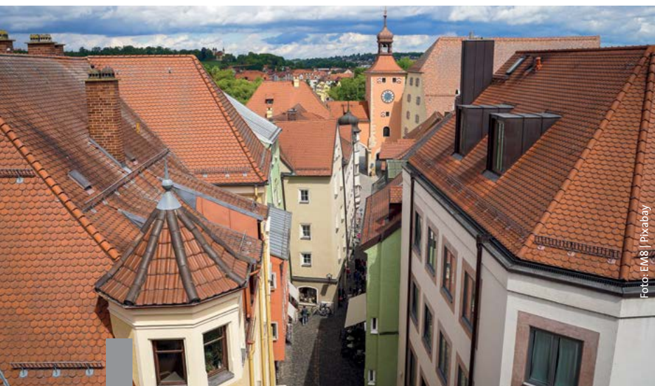
Unter den Dächern der Städte schlummern noch große Wohnraumreserven.

Der Bundestagsausschuss für Bau, Wohnen und Stadtentwicklung hat in einer Anhörung verschiedene Experten zum Thema Dachausbau befragt. Dieser wird als Chance gesehen, in Städten zusätzlichen Wohnraum zu schaffen. Dazu sind Änderungen des Baurechts in der Diskussion – von einer Genehmigungsbefreiung für einfache Aufstockungen bis hin zur Zulässigkeit einer Überschreitung der erlaubten Geschossflächenzahl ohne Ausgleichsmaßnahmen. Denkbar ist auch eine Befreiung von der Pflicht, Stellplätze zu schaffen. Auch umfangreiche neue Förderprogramme durch die KfW wurden ins Gespräch gebracht.