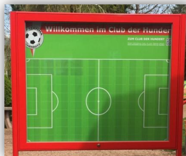
*Club der 100-Tafel