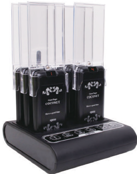
Trasmettitore e culla di ricarica

GP-206RT: include 6 cerca persone e tastiera