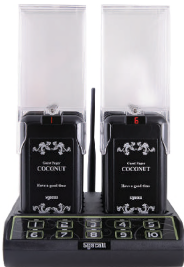
Trasmettitore e culla di ricarica

GP-210RT: include 10 cerca persone e tastiera