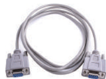
Cavo di collegamento POS seriale a USB convertitore.