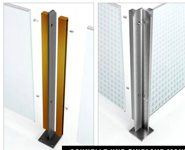
SCHNELLE UND EINFACHE MONTAGE

Das Zusammenspiel der SANCO SWISSRAILING TWO SIDED Klemmschienen mit den optimierten Geländerpfosten und dem minimierten Kantenschutz stellt im Rahmen der DIN 18008 Teil 4 Kategorie A eine designorientierte Brüstungsverglasung ohne wuchtigen Handlauf dar. Geländerpfosten und Klemmschienen können in der gleichen aber auch in unterschiedlichen Farben geliefert werden. Die Standardfarben sind RAL 7016 (Anthrazit) und RAL 9016 (Verkehrsweiß). Darüber hinaus können die Verglasungen mit keramischem Siebdruck oder transluzenten bzw. farbigen Folien ausgeführt werden.