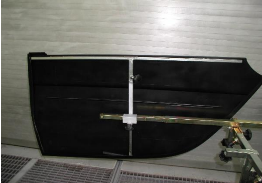
0014675V0000000 Seitentür re/li Einzelpreis: 80,00 € zzgl. MwSt