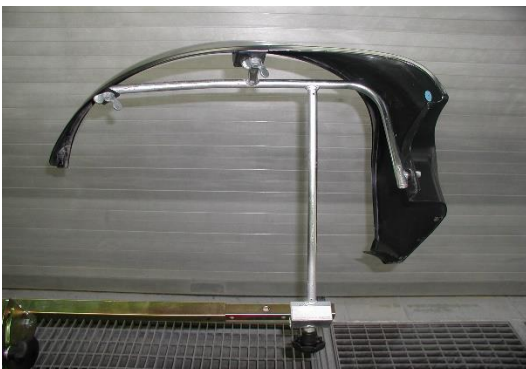
0014679V0000000 Flankenteil re. Einzelpreis: 77,50 € zzgl. MwSt