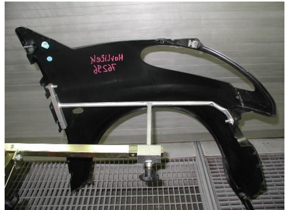
0014673V0000000 Kotflügel vo.re. Einzelpreis: 80,00 € zzgl. MwSt