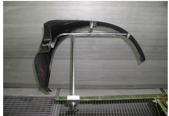
0014678V0000000 Flankenteil li. Einzelpreis: 80,00 € zzgl. MwSt