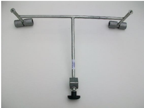
0014677V0000000 Heckmittelteil Einzelpreis: 80,00 € zzgl. MwSt