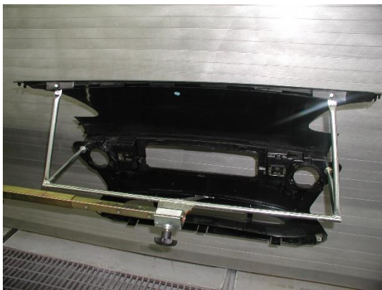
0014674V0000000 Frontmittelteil Einzelpreis: 80,00 € zzgl. MwSt