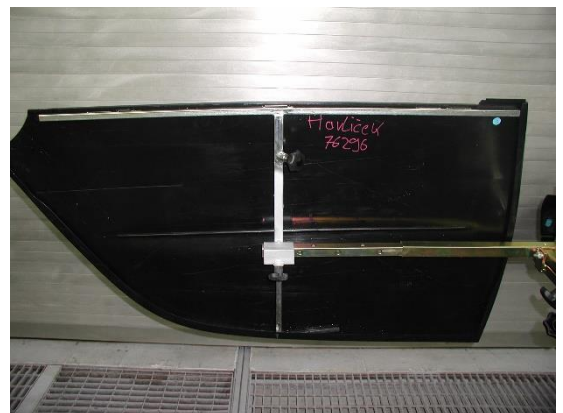
0014675V0000000 Seitentür re/ li. Einzelpreis: 80,00 € zzgl. MwSt