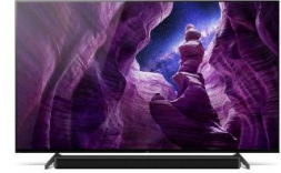
Pieds en position haute pour barre de son