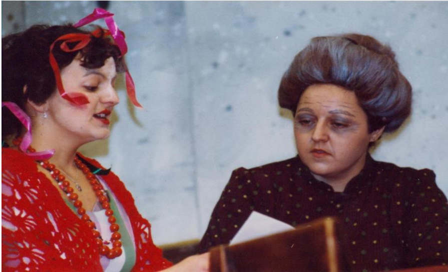
1982/83 Liebe wie es im Büchl steht