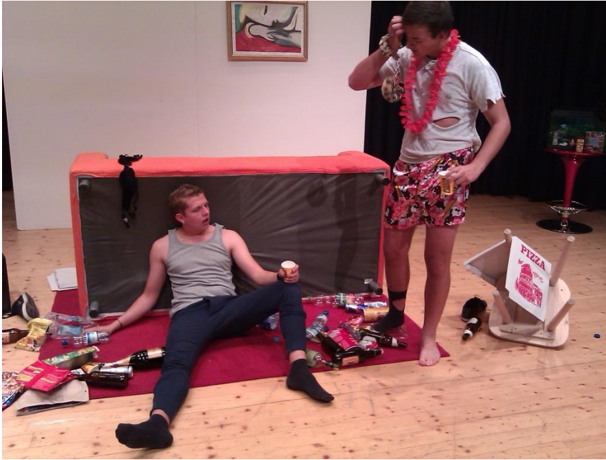
Herbst 2011 Sketche Typisch Männer – Typisch Frauen Teil 1