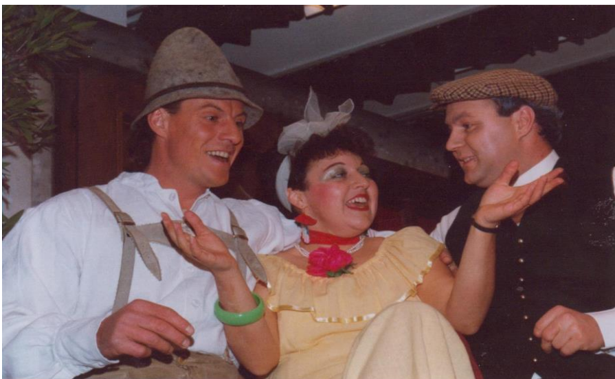
1987/88 Susi's Gspusi