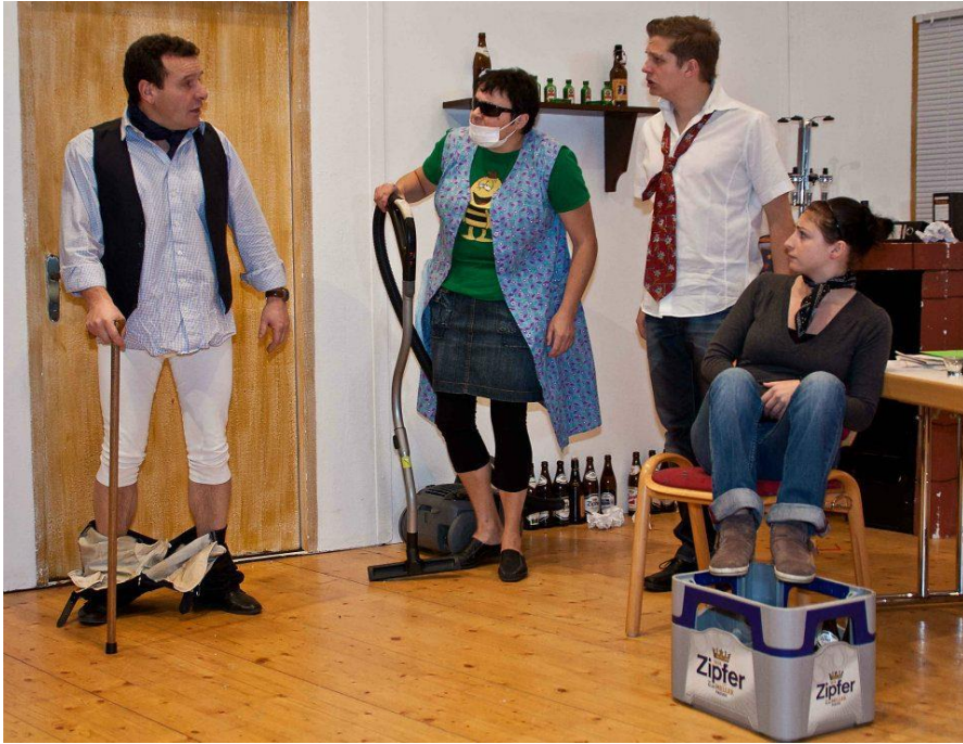
Herbst 2012 TV Nonstop (Kinderworkshop)