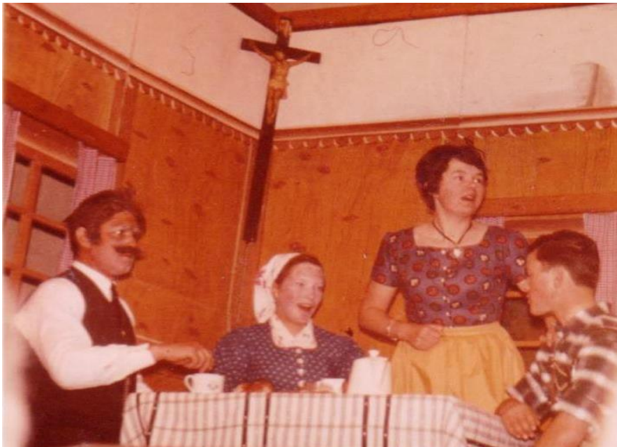
1969 S'Dirndl von der Au