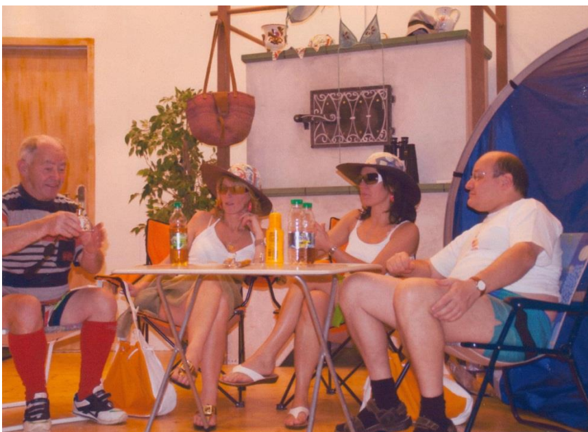
2007/08 Mit Schlafsack und Kamillentee