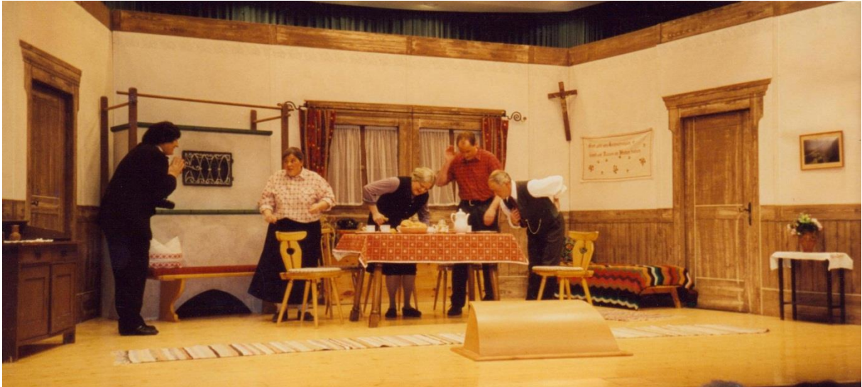
1998/99 Sajonara Fiss