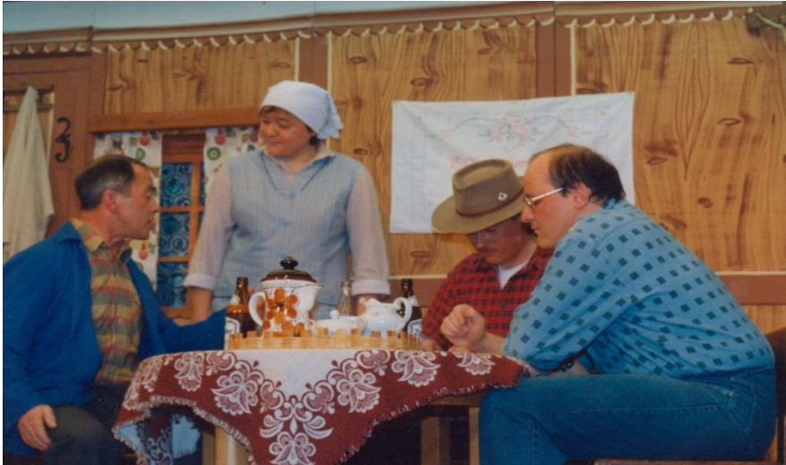
1993/94 Trautes Heim