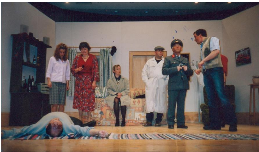
2003/04 Wohin mit der Leiche