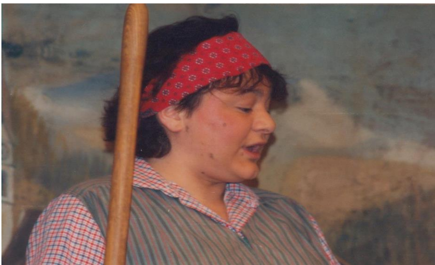
1990/91 So ein Glück