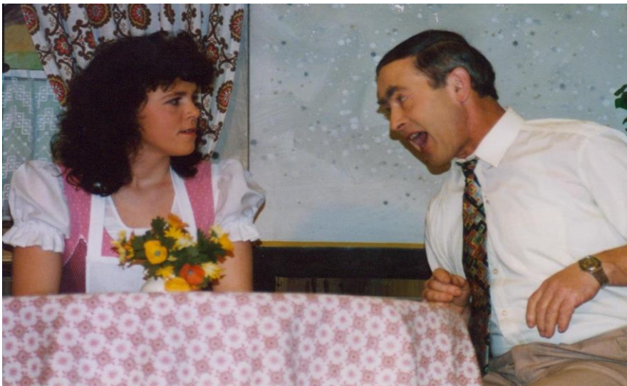
1994/95 Muckl in den Sommerfrischen