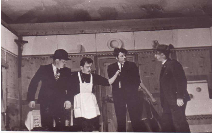
1967/68 Der noblige Hochzeiter