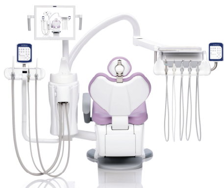
T5 EVO PLUS THE VERSATILE AND EVOLVED UNIT