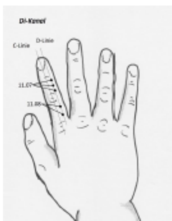
Abbildung 12 – DI-KANAL – 11.07-08

Punkte mit Namen „Jin“ = Metall wirken auf Erkrankungen des Darms, Abdomen und Speiseröhre; bessere Punktwirkung haben: 33.08 ShouWuJin, 77.25 ZuWuJin, 33.09 ShouQianJin und 77.24 ZuQianJin