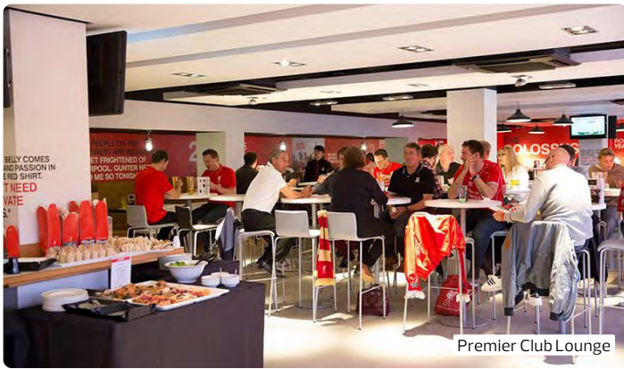
Premier Club Lounge