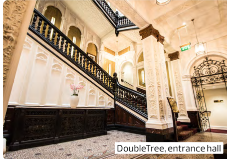
DoubleTree, entrance hall