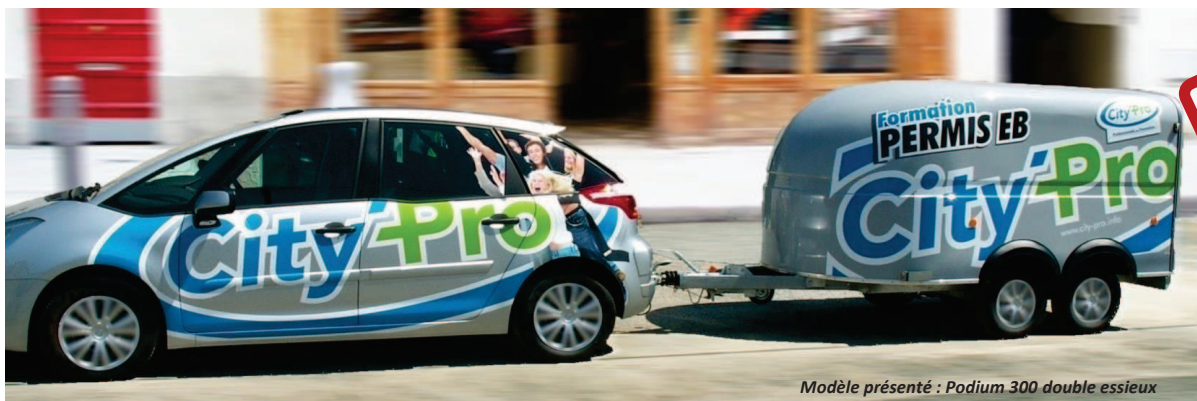
Modèle présenté : Podium 300 double essieux