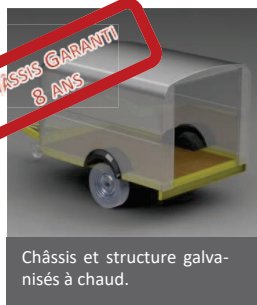
Châssis et structure galvanisés à chaud.