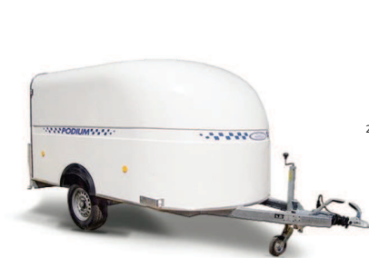
PODIUM 300 simple essieu