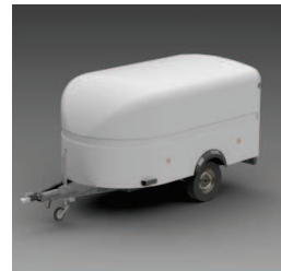
Carrosserie polyester monocoque aérodynamique.

*Possibilité selon modèle, véhicule et loi en vigueur