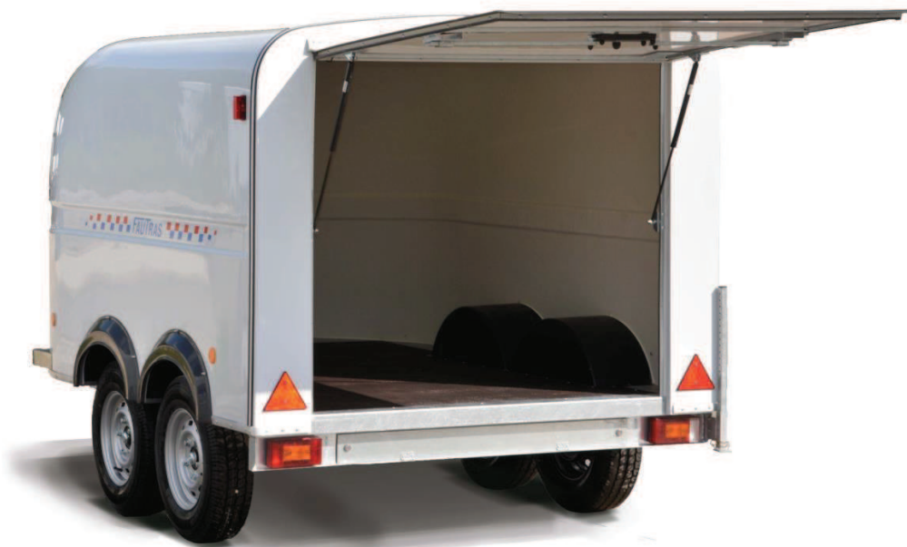
Modèle présenté : Podium 300 avec option rampe intégrée sous châssis.

Option ouvertures latérales : idéales pour les magasins ambulants.