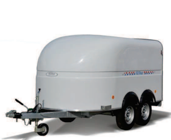
PODIUM 300 double essieux