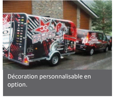
Décoration personnalisable en option.