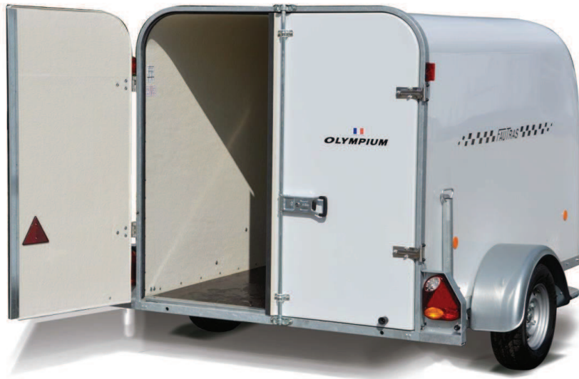
Modèle présenté : Olympium 260.