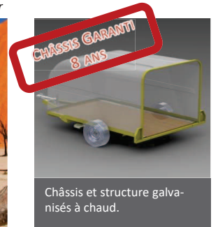
Châssis et structure galvanisés à chaud.