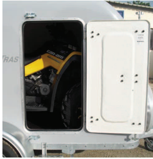
Option : La porte latérale, pour une plus grande facilité d'accès.