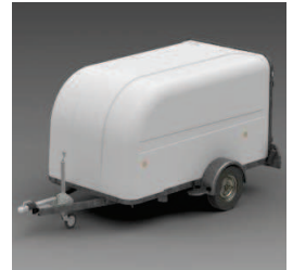
Carrosserie polyester mono-que aérodynamique.

*Possibilité selon modèle, véhicule et loi en vigueur