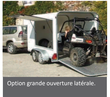
Option grande ouverture latérale.