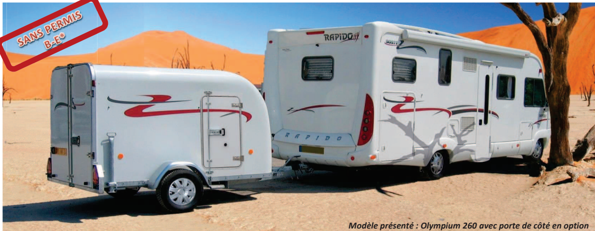
Modèle présenté : Olympium 260 avec porte de côté en option