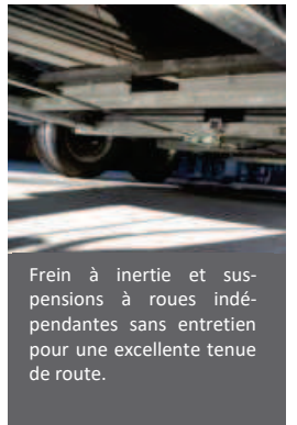
Frein à inertie et suspensions à roues indépendantes sans entretien pour une excellente tenue de route.