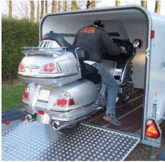
Option : Ouverture pont pour charger des motos lourdes ou une petite voiture.