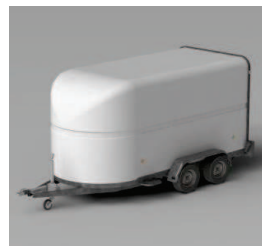
Carrosserie polyester mono-coque aérodynamique.

Equipement de série : frein à inertie, 2 essieux, roue jockey, une béquille de stabilisation, deux lumières intérieures, un antivol dans la tête d'attelage ainsi que 2 portes arrières.