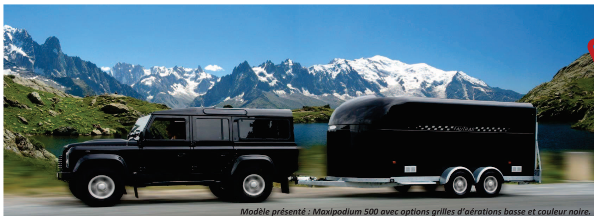
Modèle présenté : Maxipodium 500 avec options grilles d'aérations basse et couleur noire.