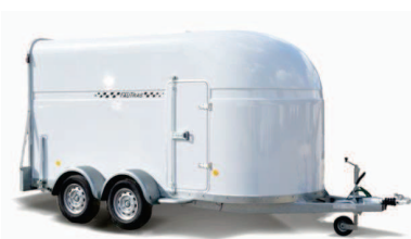
9 MAXIPODIUM 400*