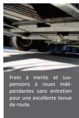
Frein à inertie et suspensions à roues indépendantes sans entretien pour une excellente tenue de route.