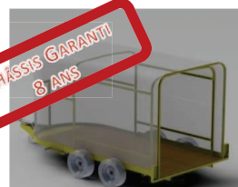
Châssis et structure galvanisés à chaud.