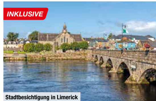
Stadtbesichtigung in Limerick