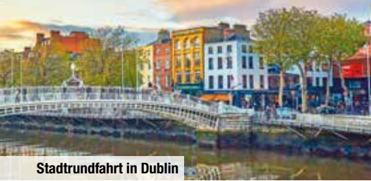
Stadtrundfahrt in Dublin