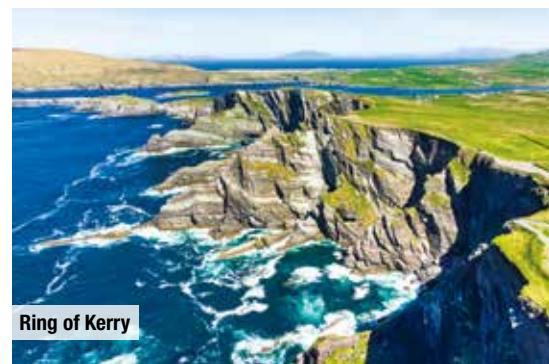
Ring of Kerry

Für noch mehr Komfort: Halbpension zubuchbar