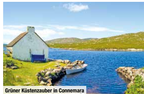
Grüner Küstenzauber in Connemara