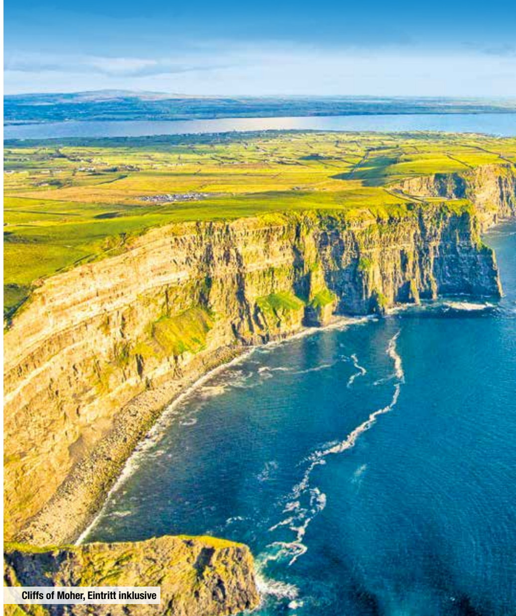
Cliffs of Moher, Eintritt inklusive

Sie entscheiden, wie Sie nach dem Frühstück den heutigen Tag verbringen wollen. Genießen Sie einen freien Tag in der ländlichen Idylle des Countys Clare/Galway oder entdecken Sie auf einem vor Ort zubuchbaren Ganztagesausflug die wunderschöne Heide- und Moorlandschaft von Connemara mit ihren zahlreichen Schafherden und dem berühmten Kloster Kylemore Abbey. Authentischer als in einem traditionellen Musik-Pub können Sie Irland nicht erleben. Treten Sie mit uns ein und lassen Sie sich von den heiteren Klängen und der Lebenslust der Iren mitreißen!