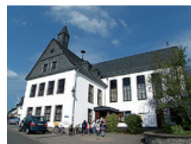
Gemeindehaus Horn Start & Ziel

Neben schönen Wanderstrecken warten ein reichhaltiges Kuchenbuffet, Hunsrücker Spießbraten und am Sonntag ein weiteres Mittagsmenu auf Sie.