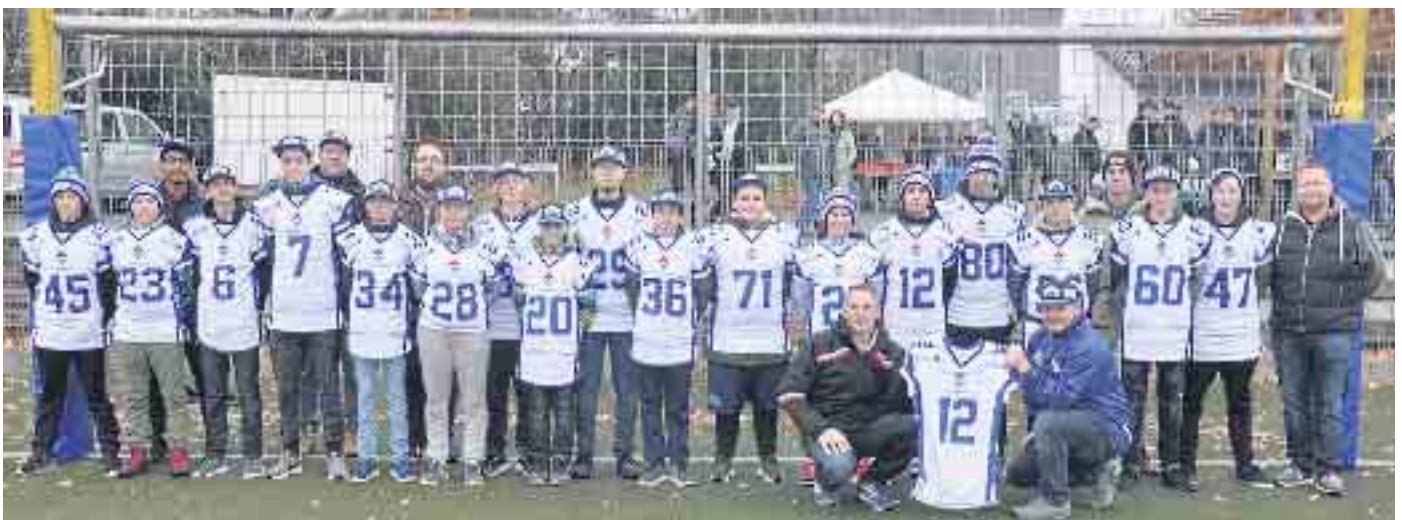
Schon im November 2018 hatte die Faßbender Stiftung die FMJ mit einem Satz neuer Trikots gesponsert.