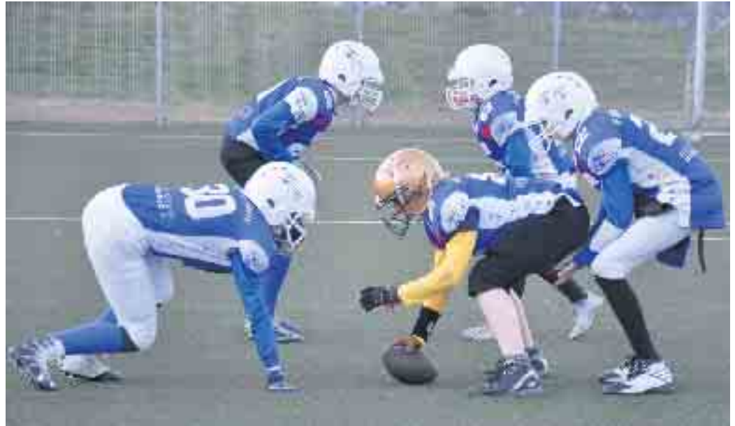
Bis auch im Training wieder direkter körperlicher Kontakt erlaubt sein wird, werden sicherlich noch ein paar Tage oder Wochen ins Land gehen.