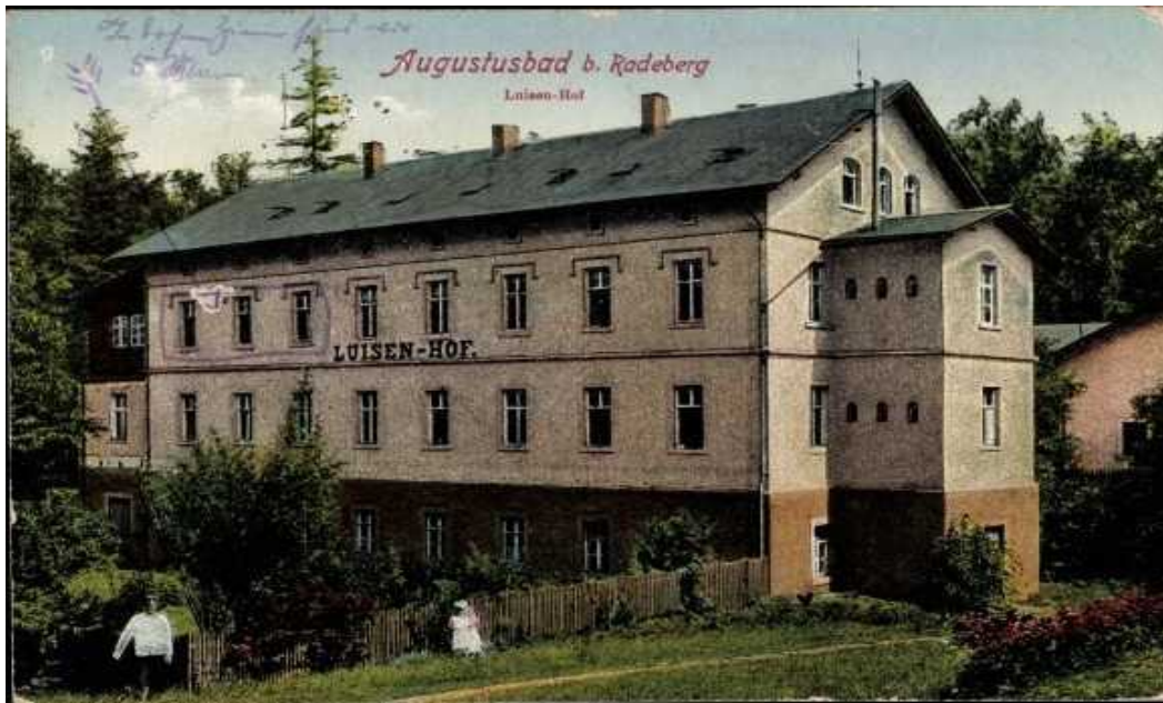
Abbildung 2: Ansichtskarte des Luisenhofs

https://www.abebooks.de/manuskripte-papierantiquitaeten/Ansichtskarte-Postkarte-Liegau-Augustusbad-Radeberg-Luisenhof/31493221001/bd?