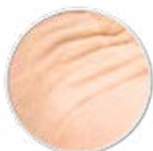
Falten erschlafte Haut