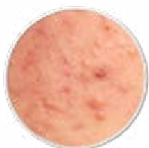
Pickel Mitesser Entzündungen