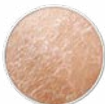
Spannungsgefühl trockene Haut schuppige Haut