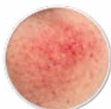
Rote Haut Äderchen Couperose