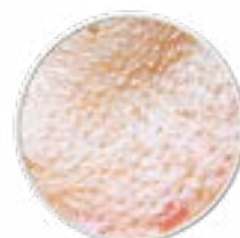
großporige Haut fettige, ölige Haut