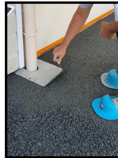
Finition des abords avec la truelle