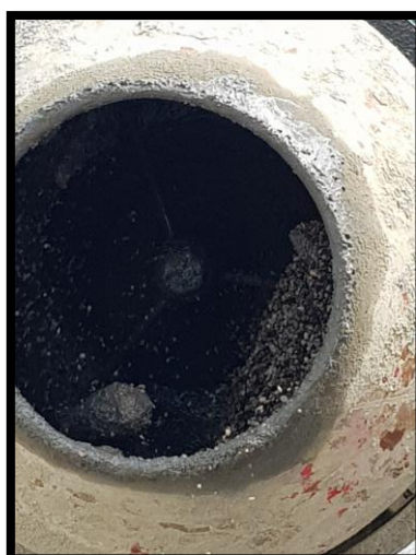
Malaxage entre 3mn et 5mn