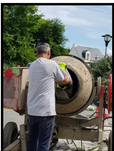
Verser 2 sacs de granulats