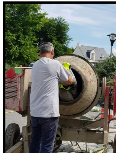
Verser 3 sacs de granulats