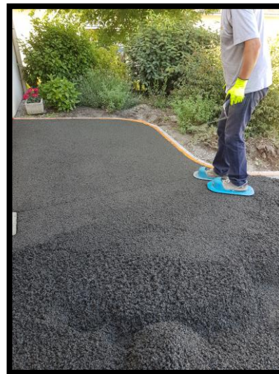
Finition du joint avec les claquettes