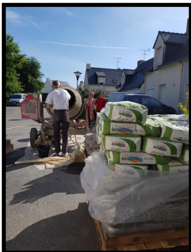
Préparation et protection espace de travail