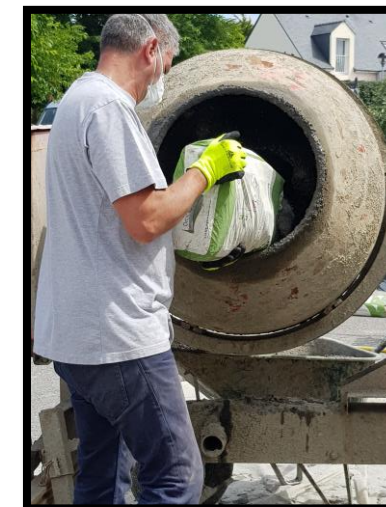
Verser 1 sac de liant