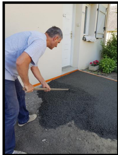
Étaler avec le râteau à dents