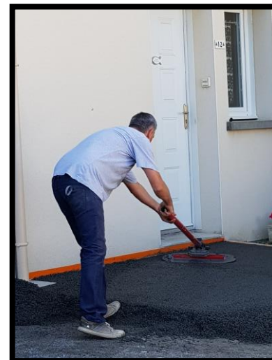
Serrer avec la lisseuse (Option)