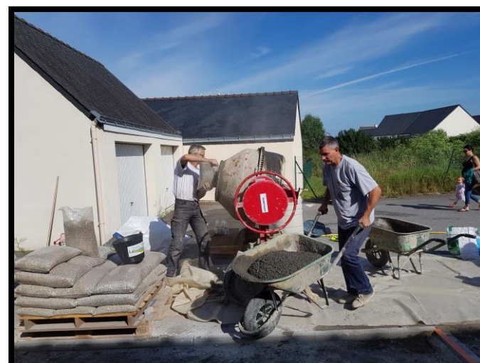
Déverser la préparation dans la brouette