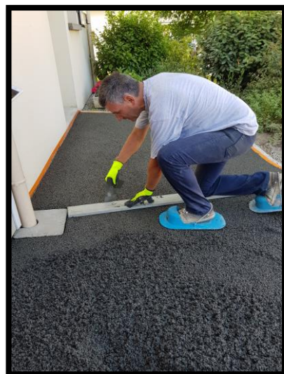
Création des joints de dilatation