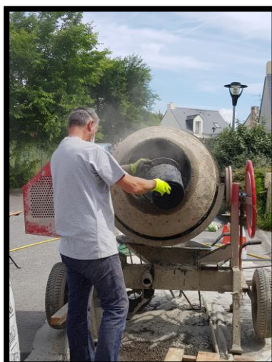
Verser 5 litres d'eau (seau gradué)