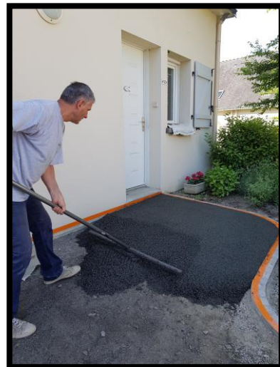
Niveler avec l'aplanissoir