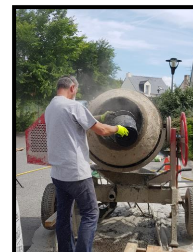
Verser 5 litres d'eau (+1 litre pour des températures >25°C)