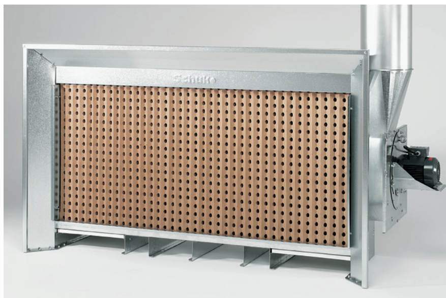
Solide Kompaktbauweise mit geringer Bautiefe – genau richtig für kleine Räume und Werkstätten.

Einfacher elektrischer Anschluss, kein zusätzlicher Schaltschrank erforderlich. Im Lieferumfang enthalten ist das Anschlusskabel mit 7 m Länge mit Motorschutzstecker und Schalter nach CEE für den Anschluss außerhalb des Ex-Bereiches.