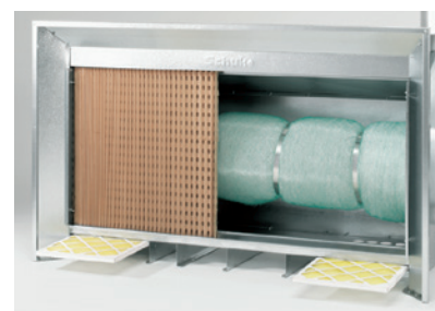
Leichte Zugänglichkeit sichert schnellen, problemlosen Wechsel der kostengünstigen Filter.