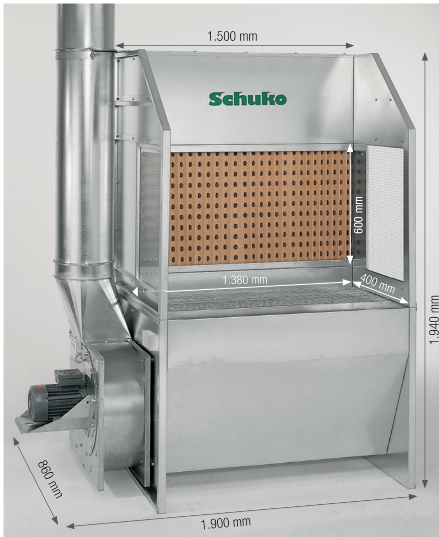
Das ideale Gerät für die Lacknebel- und Dunstabsaugung.

■ Der Schuko SAUGBOY lässt Ihre Mitarbeiter nicht länger im Nebel stehen. Das kompakte Gerät, speziell für Kleinteillackierungen entwickelt, bringt Schuko-Leistung zum günstigen Preis.