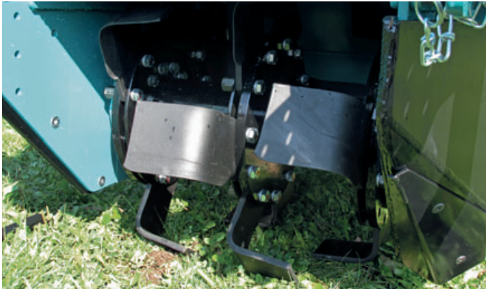
Geschl. Rotor mit Winkelmessern aus verschleißfestem Bor-Stahl

Für das effektive Roden von Stubben/Wurzelstöcken in Reihenkulturen, z.B. zur streifenweisen Rekultivierung von Weihnachtsbaum- und Obstkulturen