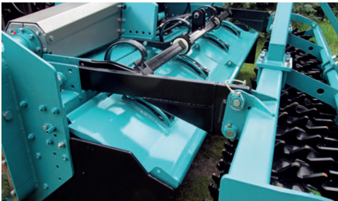
Hydraulisch einstellbare Bodenklappen, wartungsfrei federnd gelagert