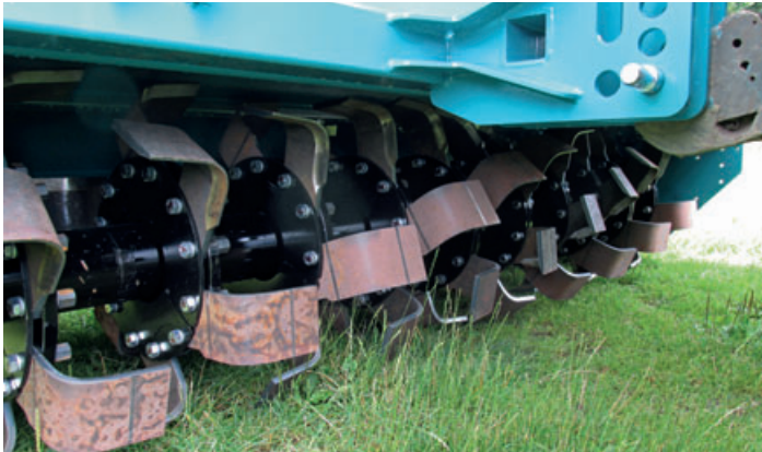
Offener Rotor mit Winkelmessern aus verschleißfestem Bor-Stahl

Für die schwere Bodenbearbeitung im intensiven Ackerbau, in Sonderkulturen wie z.B. für Weihnachtsbäume