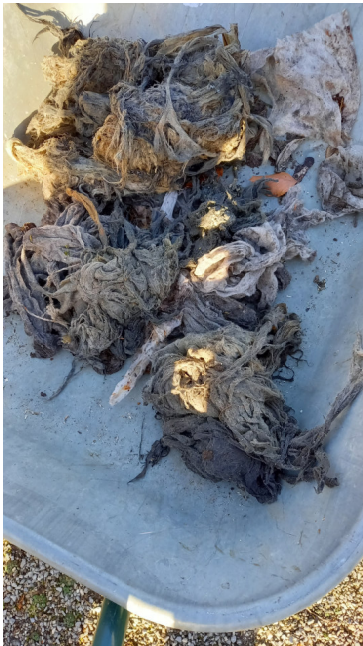
Feuchttücher aus dem Ansaugbereich der Pumpe

Die Hebepumpe für Abwasser in Garten 033 hatte einen elektrischen defekt und musste aus der Abwassergrube ausgebaut werden. Beim Säubern der Grube durch die Stadtentwässerung Mülheim (SEM) wurde festgestellt, dass sich in der Grube ein sehr großer Anteil an Feuchttüchern befanden, was beim Abpumpen zu einem Mehraufwand führte. Nach der elektrischen Reparatur drehte sich die Pumpe keinen Zentimeter. Durch einen zusätzlichen, komplizierten Arbeitsschritt musste die Pumpe komplett aus der Grube nach 25 Jahren ausgebaut werden. Der Ansaugstutzen der Pumpe saß voller Feuchttücher. Nach über eine Stunde intensiver Arbeit konnten die Feuchttücher entfernt werden. Keine angenehme Arbeit bei minus 8° C. Nach gut 25 Jahren die erste größere Reparatur unserer Hebepumpen. Entsprechend kann hier nur ein relativ neuer Pächter die Feuchttücher in unser Abwassersystem entsorgt haben. Hier noch mal der Hinweis an unsere Pächter: Feuchttücher und andere Hygieneartikel haben in unserem Abwassersystem nichts verloren. Auch nicht in das Abwassersystem zu Hause. Auf Grund von Skizzen unseres Abwassersystems lässt sich leicht lokalisieren, wo die Feuchttücher entsorgt wurden. Wenn man dann noch untersucht, wann in diesem Bereich ein Pächterwechsel stattgefunden hat, lässt sich der mögliche Übeltäter schnell finden. Entsprechend wird dann gehandelt. Ein Dank an die Gfrd. Krein, Jonik, Rebelsky und Simon, die bei diesen schwierigen Wetterbedingungen vor Ort waren um die Pumpe zu reparieren.