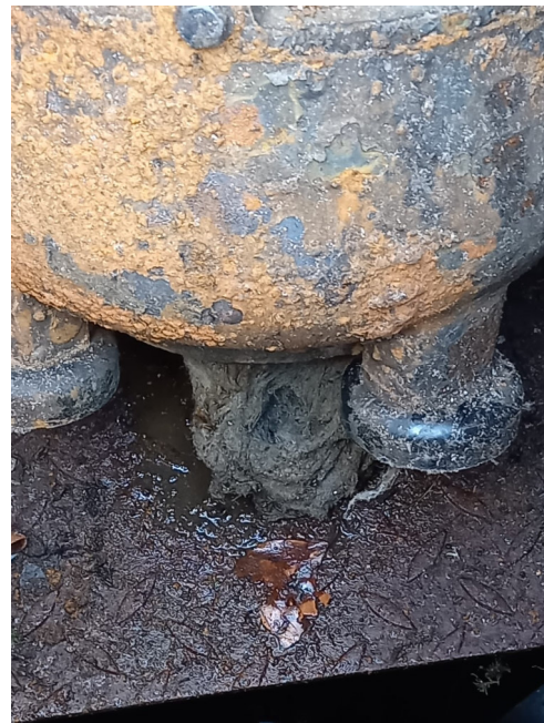
Ansaugbereich der Pumpe