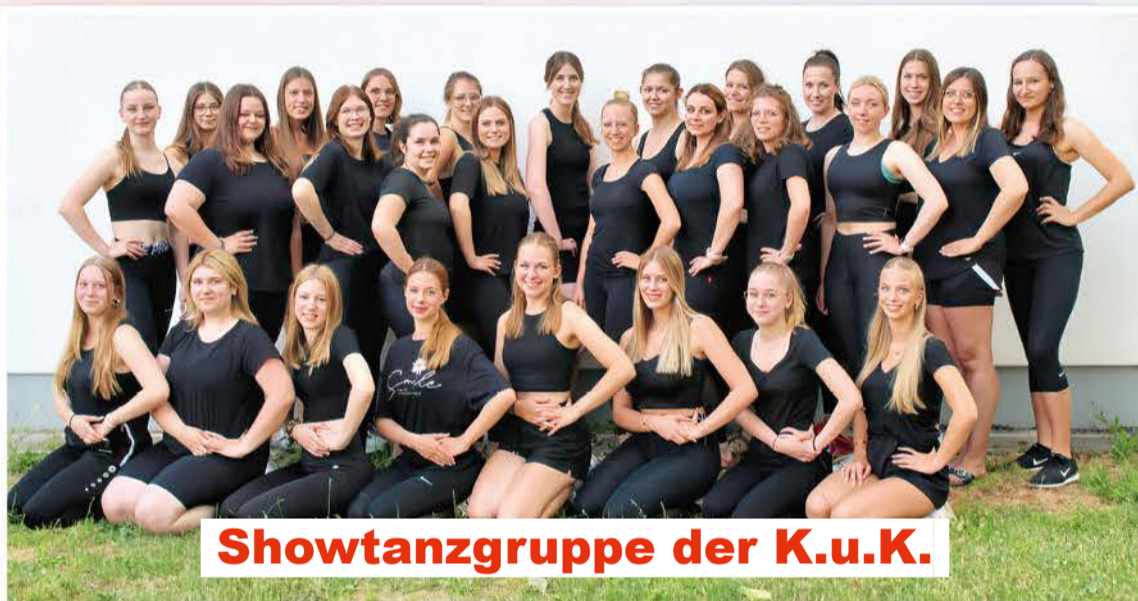
Showtanzgruppe der K.u.K.

Dürfen wir uns vorstellen: WIR sind die Showtanzgruppe der K.u.K. Rübenach... ...eine Vereinigung der ehemaligen K.u.K. Showtanzgruppen Silberfunken, Bullewätzjer und Schängelpänz, die gemeinsam die Bühnen im Rheinland zum Beben bringt. Unsere Gruppe besteht aus 29 jungen Frauen im Alter von 15-30 Jahren, die mit