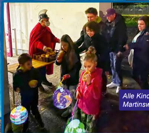
Alle Kinder bekamen ihren Martinsweck von St. Martin.