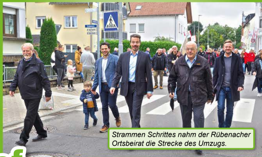
Strammen Schrittes nahm der Rübener Ortsbeirat die Strecke des Umzugs.