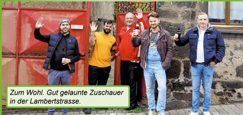
Zum Wohl. Gut gelaunte Zuschauer in der Lambertstrasse.