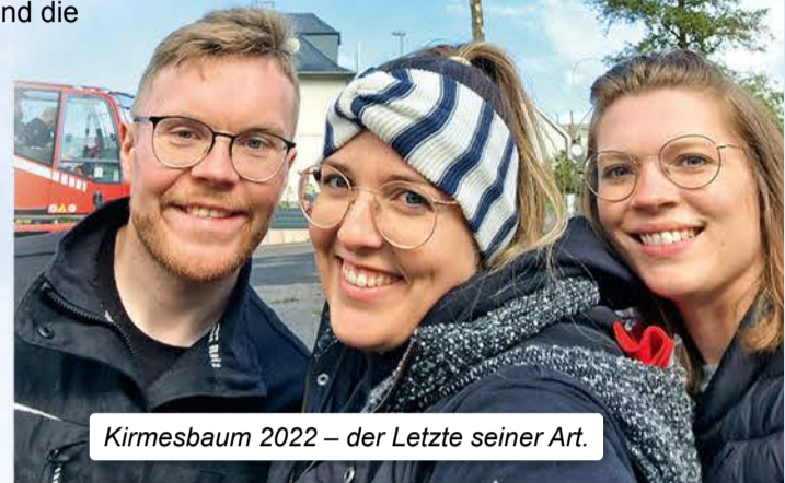
Kirmesbaum 2022 – der Letzte seiner Art.

Der Kirmesbaum aus dem Jahr 2021, der durch einen Sturm abgeknickt wurde, verdeutlicht dies. Es sind jedoch Bestrebungen im Gange, eine geeignete Alternative als Kirmesbaumersatz einzuführen, deren Errichtung dann wieder an Kirmessamstag, in einem feierlichen Rahmen und gleichzeitig als Kirmeseröffnung dienen würde. Lassen Sie sich überraschen.