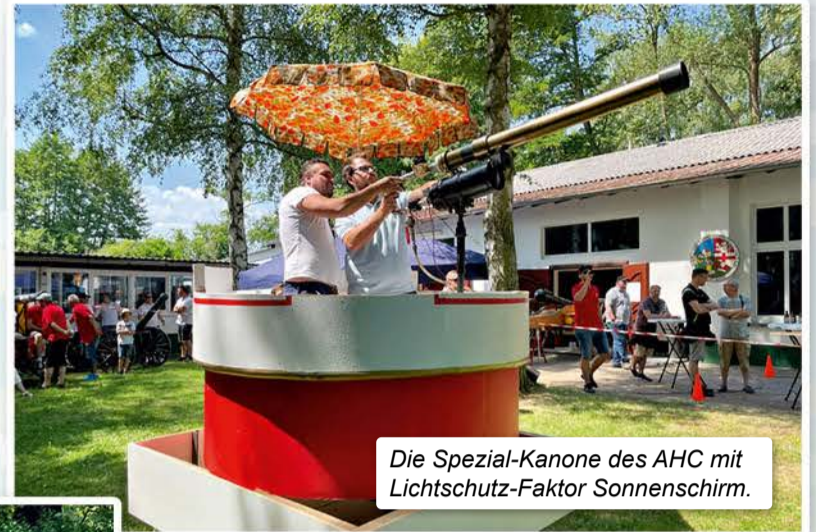
Die Spezial-Kanone des AHC mit Lichtschutz-Faktor Sonnenschirm.

In verschiedenen Wettkämpfen waren nicht nur Treffsicherheit, sondern auch Teamgeist und ein hohes Maß an Geschicklichkeit im Umgang mit der Konfetti-Wumme gefragt. Teams ohne eigenes Sportgerät konnten mit der Kanone „Greif von Auerbach“ der K.u.K. Rübenach am Wettstreit teilnehmen.