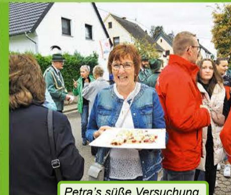
Petra's süße Versuchung.