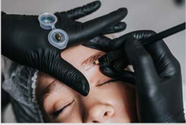
PhiBrows - Microblading