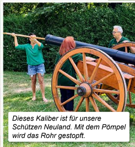
Dieses Kaliber ist für unsere Schützen Neuland. Mit dem Pömpel wird das Rohr gestopft.

In den Disziplinen Torwand-Schießen, Sommer-Biathlon, Dosenschießen und Konfetti-Munition packen duellierten sich die teilnehmenden Vereine mit viel Sportgeist und noch mehr Spaß. Ein besonderer Dank gilt dem Projekt ARES, die das Schießkino zu Verfügung stellten.