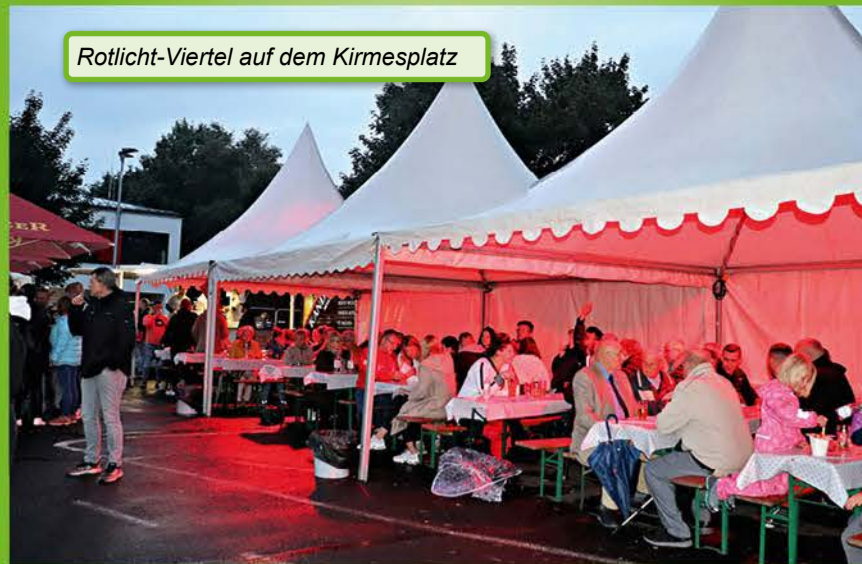
Rotlicht-Viertel auf dem Kirmesplatz