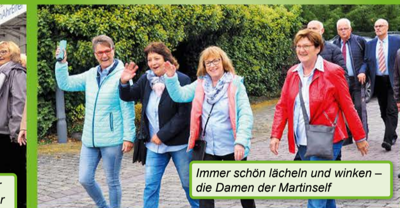
Immer schön lächeln und winken – die Damen der Martinself