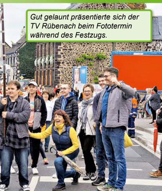
Gut gelaunt präsentierte sich der TV Rübenaach beim Fototermin während des Festzugs.