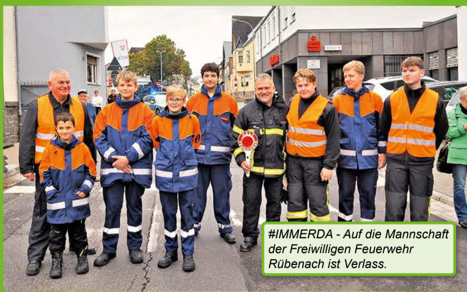
#IMMERDA - Auf die Mannschaft der Freiwilligen Feuerwehr Rübenach ist Verlass.