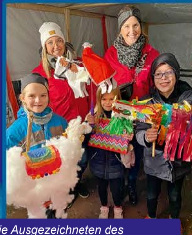
Die Ausgezeichneten des Laternen-Wettbewerbs

Auch in diesem Jahr findet unser traditionelles St. Martinsfest mit Umzug statt. Am 4. November 2023 möchten wir gerne mit euch die Straßen von Rübenach mit bunten Laternen erleuchten. Es lohnt sich kreativ zu sein und Laternen zu basteln, denn unser Laternenwettbewerb wird auch in diesem Jahr wieder stattfinden. Für das leibliche Wohl für Jung und Alt wird auch in diesem Jahr wieder gesorgt sein.