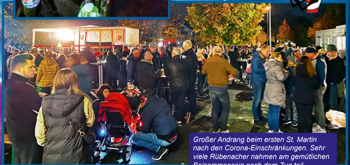
Großer Andrang beim ersten St. Martin nach den Corona-Einschränkungen. Sehr viele Rübenacher nahmen am gemütlichen Beisammensein nach dem Zug teil.