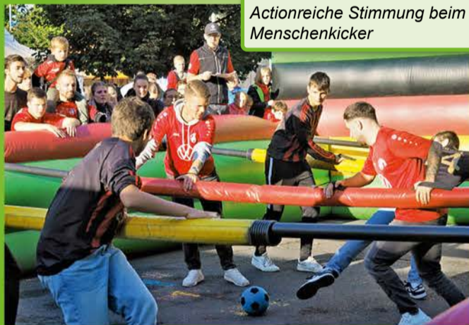
Actionreiche Stimmung beim Menschenkicker

E-Mail: Raumausstattung.zavelberg@t-online.de