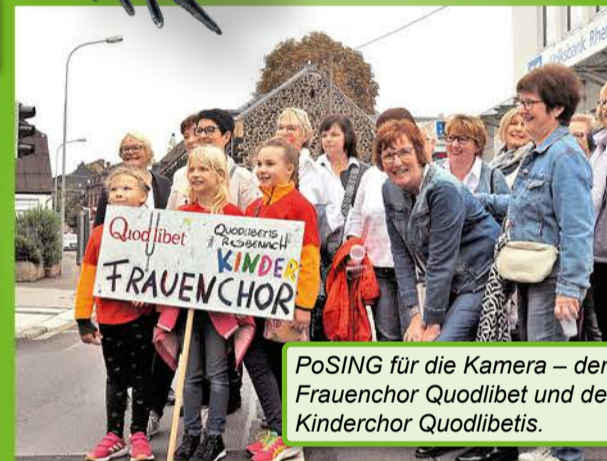
PoSING für die Kamera – der Frauenchor Quodlibet und der Kinderchor Quodlibetis.