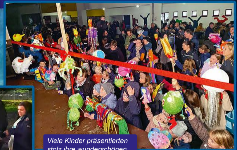
Viele Kinder präsentierten stolz ihre wunderschönen, selbstgebastelten Laternen.