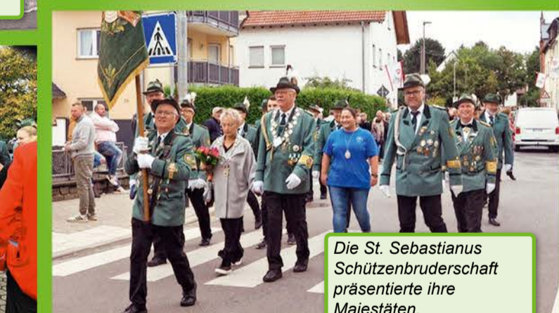
Die St. Sebastianus Schützenbruderschaft präsentierte ihre Majestäten.