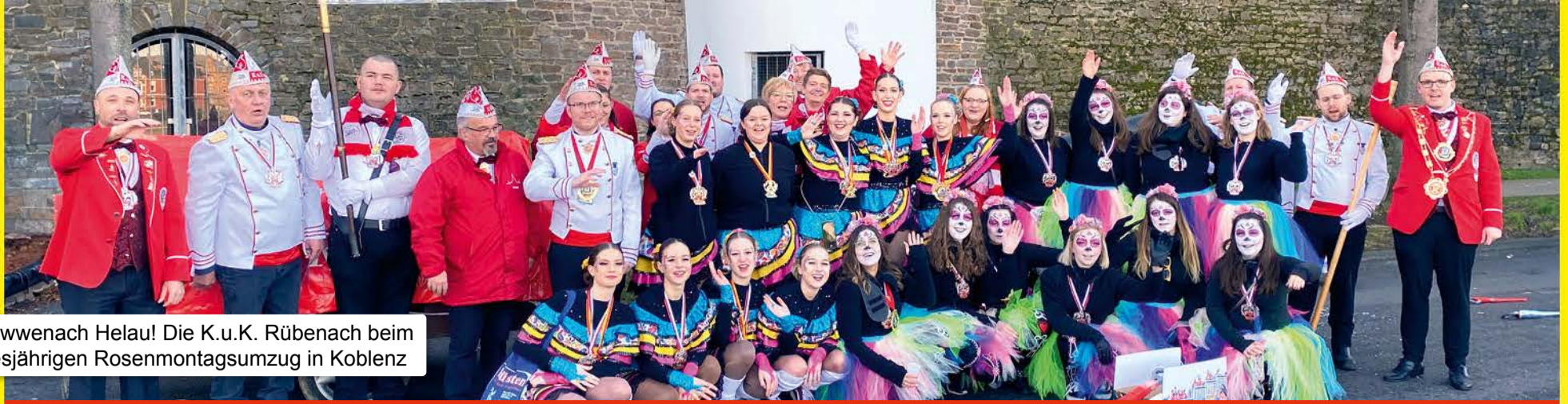
Rüwenach Helau! Die K.u.K. Rübenach beim diesjährigen Rosenmontagsumzug in Koblenz