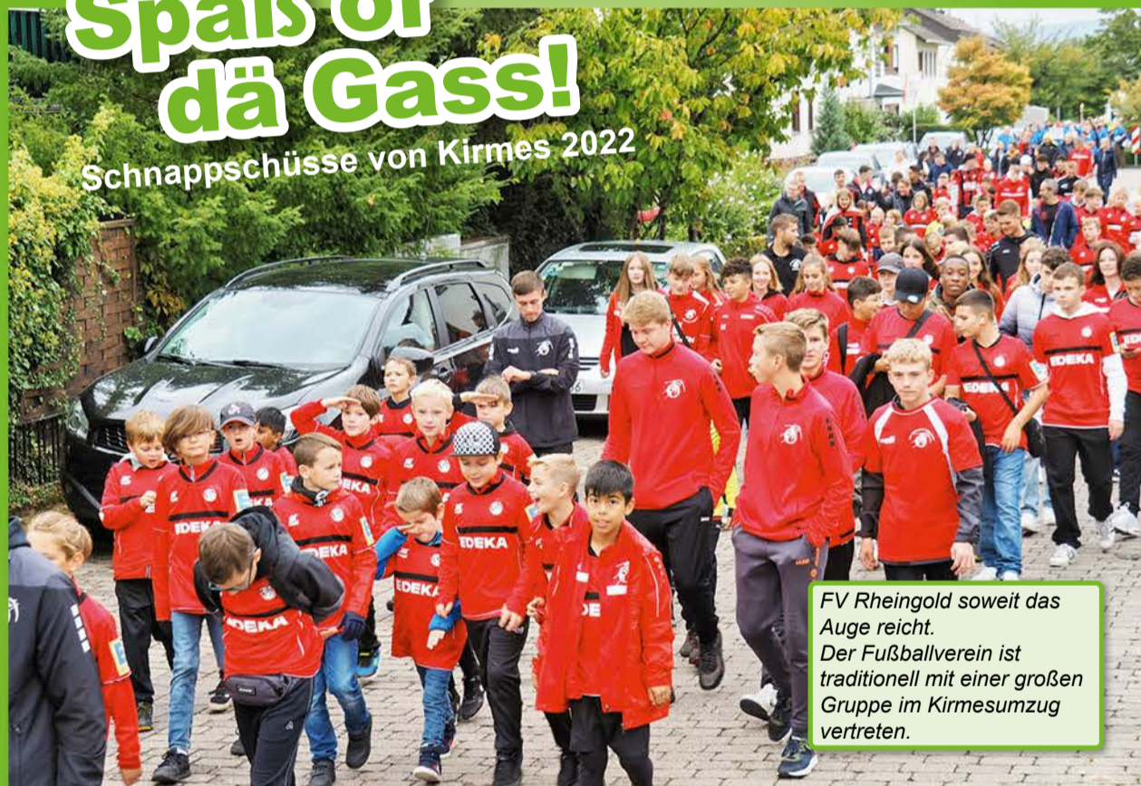
FV Rheingold soweit das Auge reicht. Der Fußballverein ist traditionell mit einer großen Gruppe im Kirmesumzug vertreten.