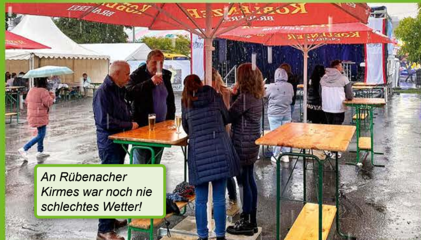
An Rübener Kirmes war noch nie schlechtes Wetter!