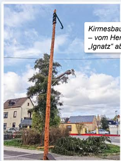
Kirmesbaum 2021 – vom Herbststurm „Ignatz“ abgeknickt.

Wie bereits in der letzten Kirmeszeitung angekündigt, werden wir in diesem Jahr keinen Kirmesbaum mehr aufstellen. Das bedeutet jedoch nicht, dass wir kein Kirmeswahrzeichen in dieser Form mehr haben werden. Die althergebrachte Fichte aus dem Rübener Wald, die jahrzehntlang die Rübener Kirmes begleitete, hat jedoch ausgedient. War das Aufstellen mit Muskelkraft einer der Höhepunkte im Kirmesprogramm, hat die Errichtung des Baumes durch einen Motorkran schon stark an Faszination eingebüßt. Die Tatsache, dass dies bereits eine Woche vor der eigentlichen Veranstaltung geschah, hat weiter dazu beigetragen, dass vom Baum eigentlich niemand mehr Notiz nahm. Dazu kommt, dass die wenigen Fichten im Rübener Wald, die die trockenen Sommer und die Borkenkäferplage überlebt haben, derart geschwächt sind, dass sie als Kirmesbaum nicht mehr geeignet sind.