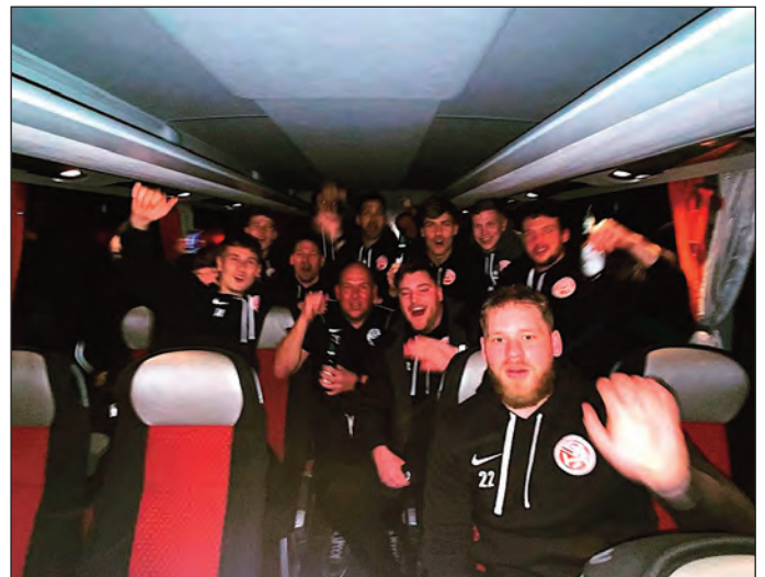
Foto: Feucht fröhliche Heimfahrt des Teams im Bus nach der geschafften Qualifikation

Der Mannschaft und Trainerteam dazu: Herzlichen Glückwunsch.