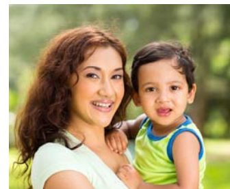
Noch bis November findet das „Café des Lächelns“ wöchentlich in der Familieninsel statt.

Das Café des Lächelns wird mittlerweile sehr gut angenommen. Daher suchen wir nach einer Möglichkeit, das Projekt zu verlängern.