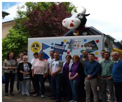
Die große Hüpfburg wird neue Attraktion bei unseren Veranstaltungen. Herzlichen Dank an alle Sponsoren!

Das Spielmobil soll zukünftig bei Kinderfesten und Aktionen eingesetzt werden und kann auch für eigene Veranstaltungen ausgeliehen werden.