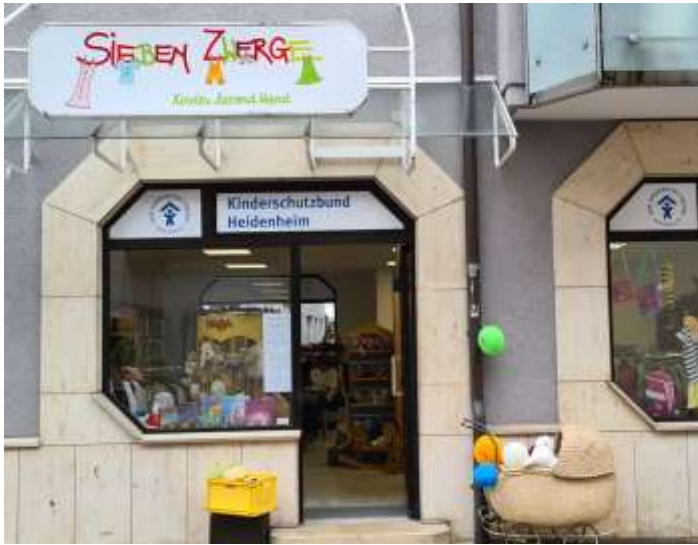
Das neue Domizil in der August-Lösch-Straße

Der Sieben-Zwerge-Laden in der Hinteren Gasse war zwar schon seit einiger Zeit zu eng geworden, aber an Umzug dachten wir nicht. Die gute Lage direkt neben der Fußgängerzone und die Furcht vor überhöhten Mieten hielten uns davon ab.