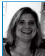
Rossana Boss Verwaltung (Minijob)