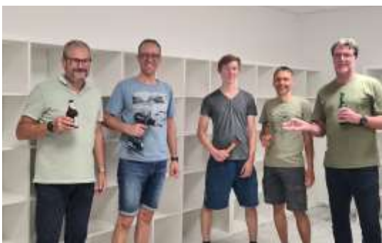
Bis die ersten Regale eingeräumt werden konnten, waren die Männer gefragt, die neuen Regale aufzubauen...

Nun begann die eigentliche Arbeit. Alles musste seinen neuen Platz finden. Hier zeigte sich der großartige Teamgeist aller Mitarbeiter. Alle halfen tatkräftig mit und richteten den neuen Laden liebevoll ein. Zahllose Stunden wurden hierbei geleistet bis jedes Regal an Ort und Stelle stand, und auch die handwerk-