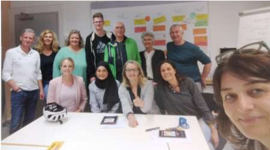
Team und Vorstand erarbeiteten in einer Klausurtagung gemeinsam die Ziele und Maßnahmen für das kommende Aktionsjahr.